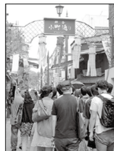
にぎわう「小町通り」

市の観光案内所によると、案内所に来られる外国人は、ヨーロッパ、アメリカ、カナダ、東南アジアの方が多いとのこと。