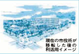
現在の市役所が移転した後の利活用イメージ

鎌倉市役所(現在地)・梶原四丁目用地(野村総合研究所跡地)・深沢地域整備事業用地(行政施設用地)、扇湖山荘、資生堂鎌倉工場跡地(寄付予定部分)などの公的不動産を利活用したまちづくり 経営企画課...内線 2565