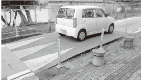
道路に設置されたハンブの例 沖縄県浦添市仲西小学校の通学路。

市役所敷地内で最新のハンブを使用した体験会を開催します。先着20人。 1月28日(日) : 集合は市役所全員協議会室(本庁舎2階) 午後1時30分から 1月15日~26日の平日に、