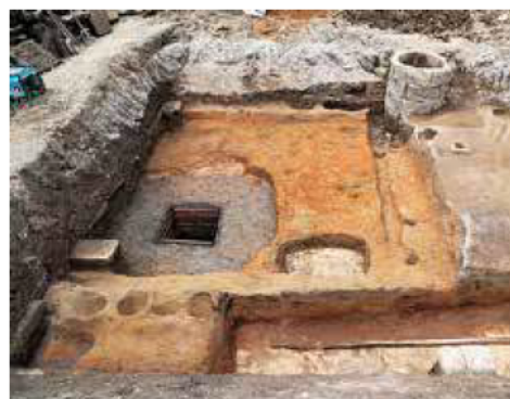
若宮大路周辺遺跡群の遺構(大町一丁目)

鎌倉の地下には、数百年前の鎌倉に住む人々の生活の実像を語る多くの遺跡が眠り、現在も発掘調査が進められています。本展では、そのうち若宮大路周辺遺跡群と大倉幕府周辺遺跡群を出土品と関連資料により紹介します。 とき…1月4日(木)~3月17日(土) 午前10時~午後4時(入館は3時30分まで)。日曜・祝日 休館 解説…土曜日 午前11時 観覧料…一般300円。市