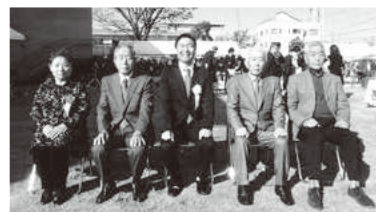
11/26(日)に、大船中学校で表彰されました