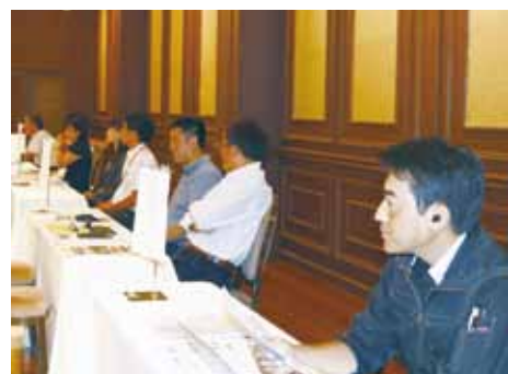
採用担当者が待ち受けるブース

「セカンドライフかまくら」主催の合同就職説明会(7/27・写真上下)。市民39人と事業者10社が参加し、事業者のプレゼンテーションの後、興味を持った人と各ブースの採用担当者が面談を行いました。次回は10/25開催(詳細は2面)。