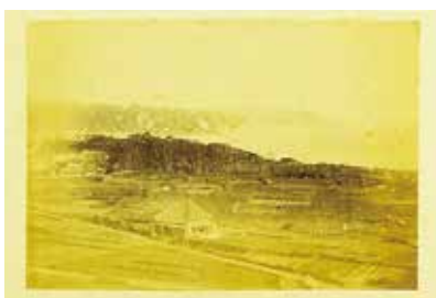
鎌倉古写真(由比ヶ浜遠望)

【同時開催】明治150周年記念古写真展「激動の鎌倉」 幕末・維新期の激動に揺らぎ、後に保養地・別荘地として急速に変貌していく鎌倉の姿を、当時撮影された貴重な古写真でたどります。