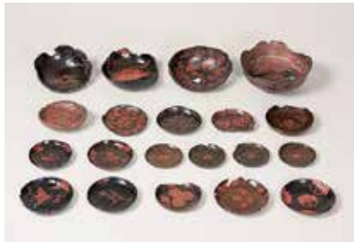
鎌倉出土漆絵椀・皿

【企画展】「出土漆器の美」 鎌倉で出土した漆絵の椀や皿、漆器製作に関する道具類、さらに鎌倉国宝館所蔵の鎌倉彫や彫漆などを一堂に展覧し、中世における漆器の生産と消費の様態や、人々の嗜好性を探ります。