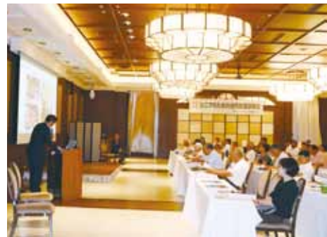
事業者が熱心に仕事の説明をしました

「セカンドライフかまくら」主催の合同就職説明会(7/27・写真上下)。市民39人と事業者10社が参加し、事業者のプレゼンテーションの後、興味を持った人と各ブースの採用担当者が面談を行いました。次回は10/25開催(詳細は2面)。