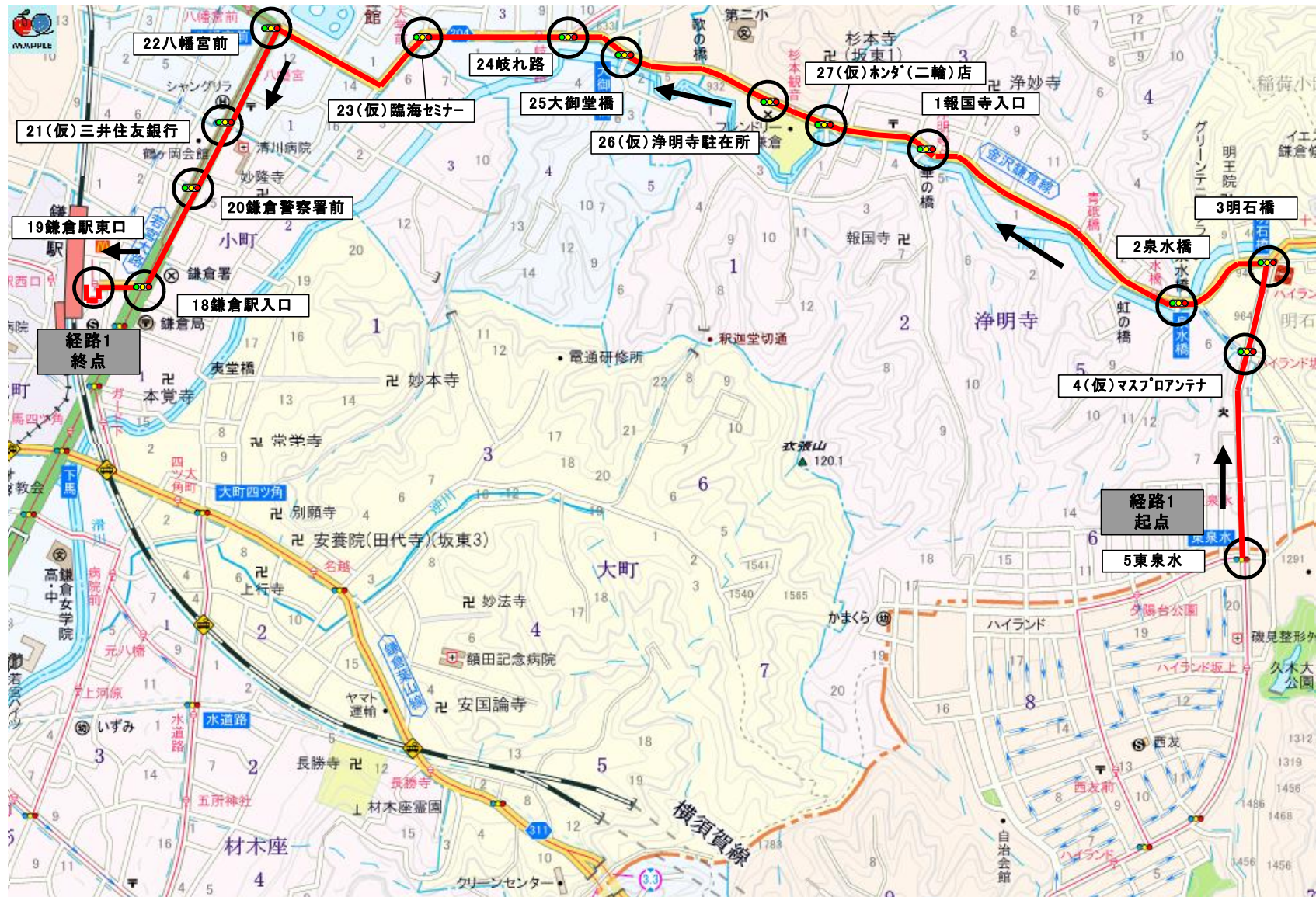
図1 経路1ルート図（在来の路線バスに該当する経路）