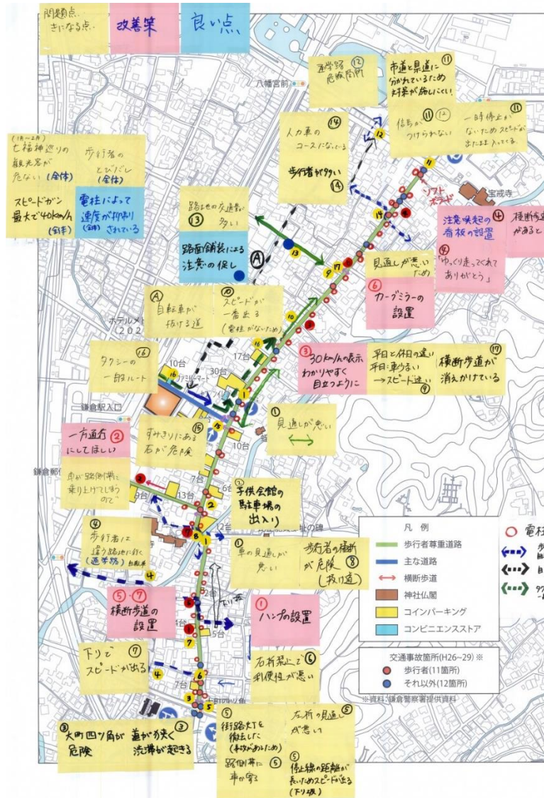
【ワークショップで作成した図面】