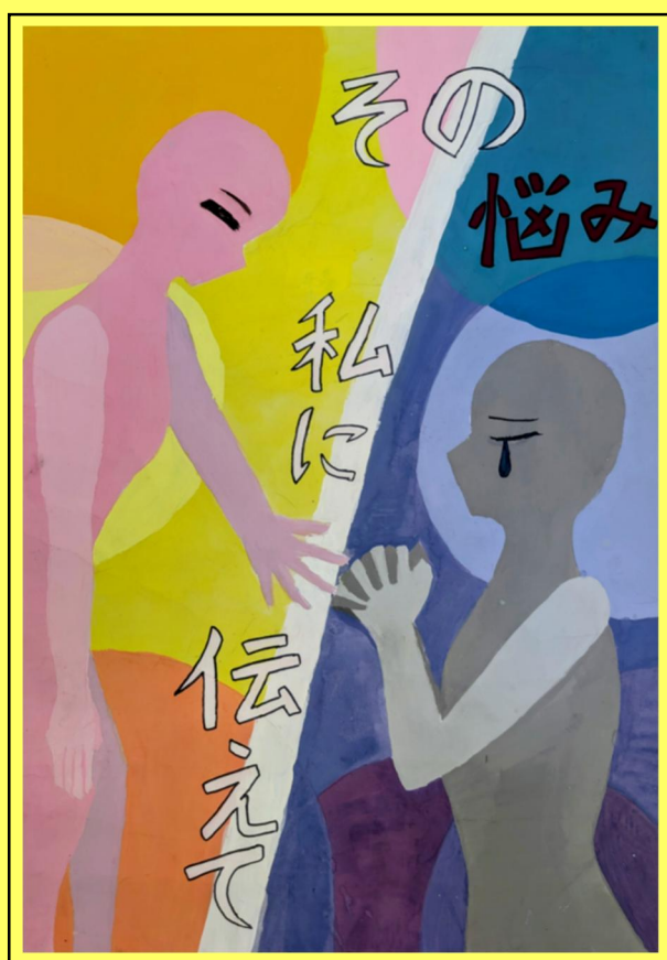
第75回社会を明るくする運動ポスターコンテスト 最優秀賞 受賞作品