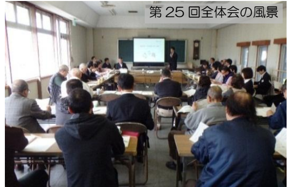
第 25 回全体会の風景