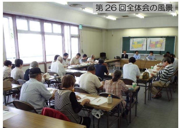
第 26 回全体会の風景