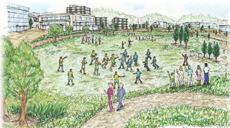
公園・行政施設のイメージ