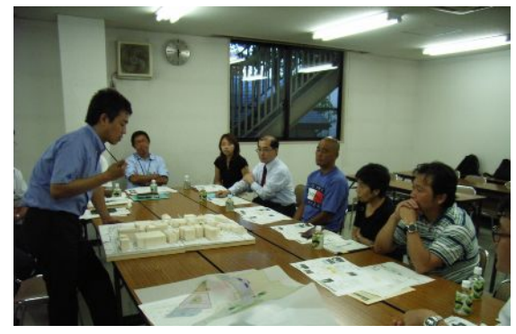
第1回商業部会の様子 →

昨年度までの「鎌倉駅西口駅前共同化事業検討会」が、「鎌倉駅西口駅前共同化事業準備会」へ移行しました。準備会には、住宅業務部会と商業部会の2つの部会を設け、それぞれの立場による検討を行っています。