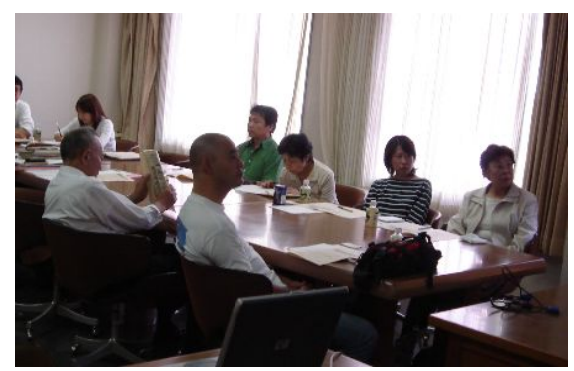
第1回住宅業務部会の様子 →