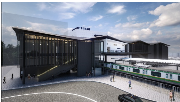
※現時点でのイメージであり、今後変更が生じる場合があります。