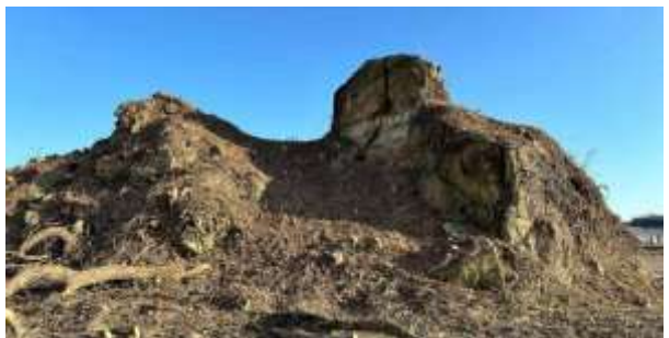
伐採後の状況2(北西側から撮影)