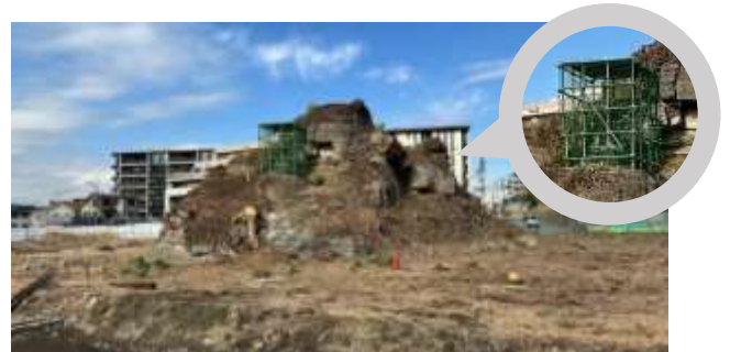
伐採後の状況1(南側から撮影)

※泣塔の防災工事についてのお問い合わせは、 教育文化財部文化財課文化財担当 TEL:0467-61-3857