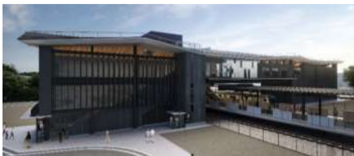
新駅イメージパース

令和6年(2024年)10月に着手したJR東海道本線大船駅及び藤沢駅間の新駅の工事が進められ、現在、線路切換工事を行うための準備工事が行われています。引き続き、神奈川県、藤沢市、鎌倉市及びJR東日本の4者で調整を行いながら、JR東日本が工事を実施していきます。