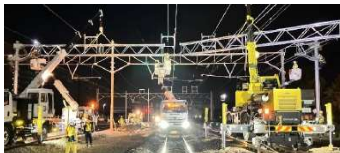
新駅工事の様子