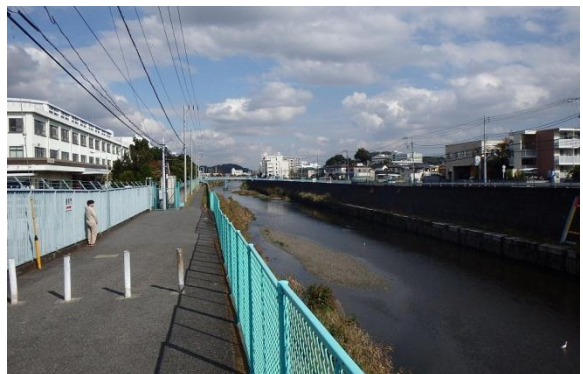
柏尾川（シンボル道路との交差位置）