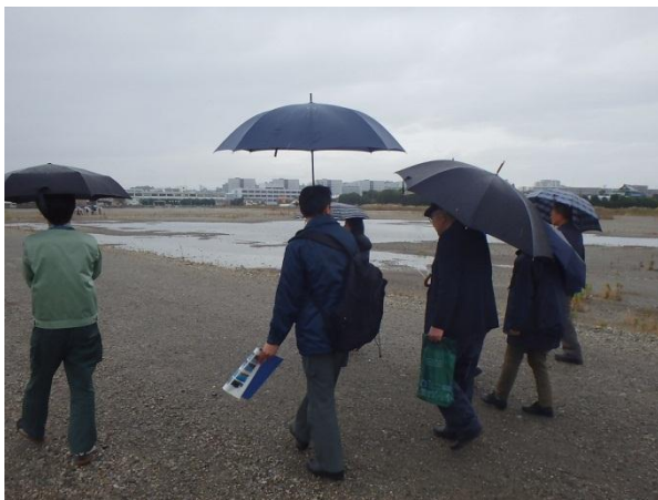
J R 工場跡地内