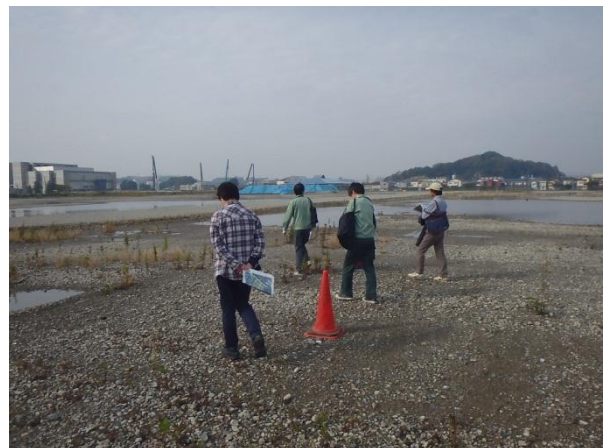
J R 工場跡地内