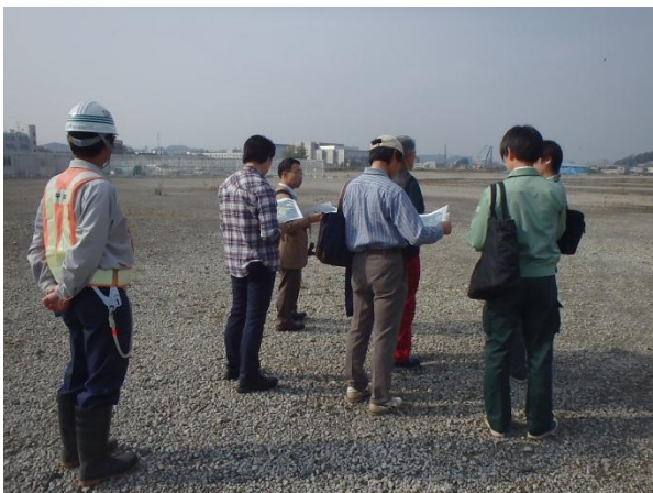
J R 工場跡地内