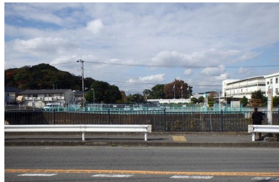
シンボル道路との交差位置