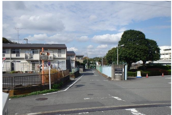
神戸製鋼横（新駅方面）