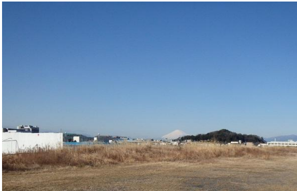
泣塔付近からの景観