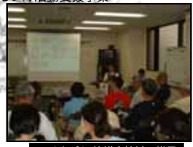
37 まちづくり協議会検討の様子