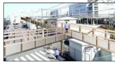
10 ベストランデッキ整備のイメージ