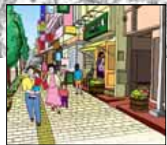
4-16 松竹通り沿道形成のイメージ