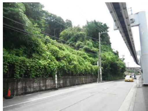
平成 29 年度の指定をめぐす特別緑地保全地区指定候補地(上町屋地区)