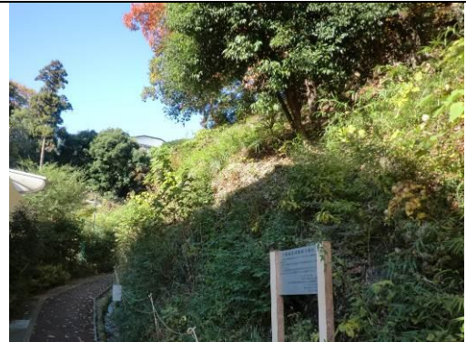
玉縄城跡としての歴史文化資源を保全した玉縄城址地区特別緑地保全地区