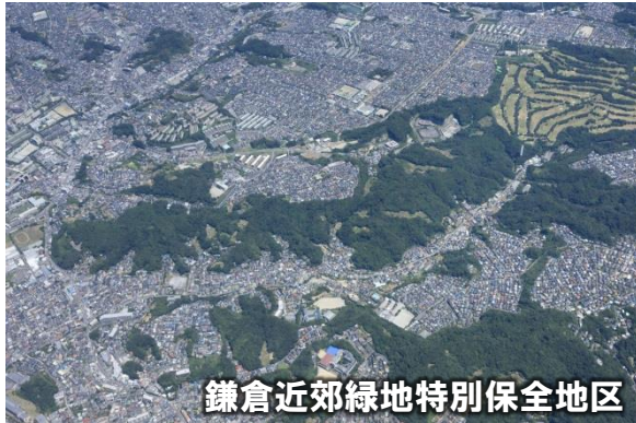
鎌倉近郊緑地特別保全地区