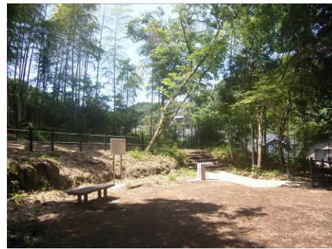
広場の整備工事を行った(仮称)山ノ内東瓜ヶ谷緑地