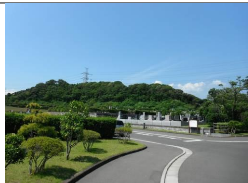
平成 28 年度に買入れた鎌倉近郊緑地特別保全地区(十二所地区)