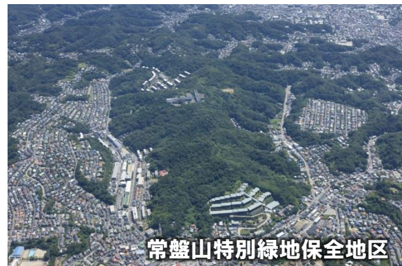
常盤山特別緑地保全地区