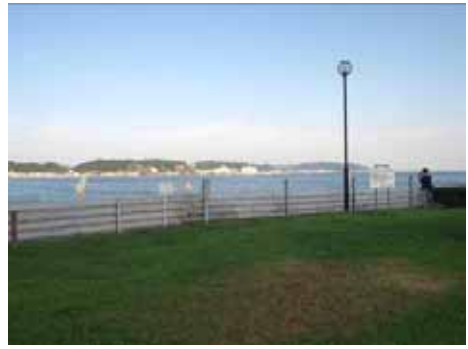
海浜公園(坂ノ下付近)

海辺の開放的パノラマ景観を保全すると共に、市街地を取り囲む山並みへの眺望を保全し、市街地が海と山に囲まれている都市の構造を視覚的に認識できるようにする。 （鎌倉市景観計画）