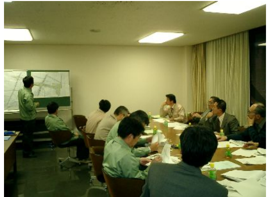
↑ 第 1 回事業化推進部会の様子