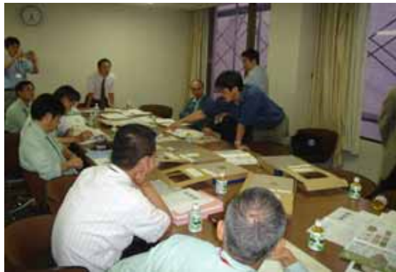
第4回事業化推進部会の様子

会議では、市役所・御成小学校前歩道整備、市役所通りの舗装材、交差点改良計画などについて、検討を行いました。