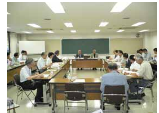
第23回まちづくり協議会の様子

会議では推進体制、年間実施計画、市役所前交差点関連事業、駅前広場レイアウトの検討、まちづくり交付金事業導入の紹介など、平成16年度検討してきた内容の報告がありました。