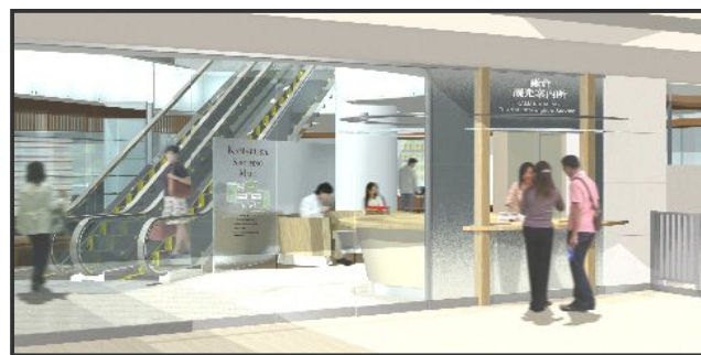
【 JR鎌倉駅東口駅構内の観光案内所のイメージ図 】