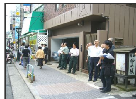
【 第15回部会 まち歩きの様子 】