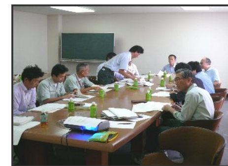
【 第16回部会の様子 】