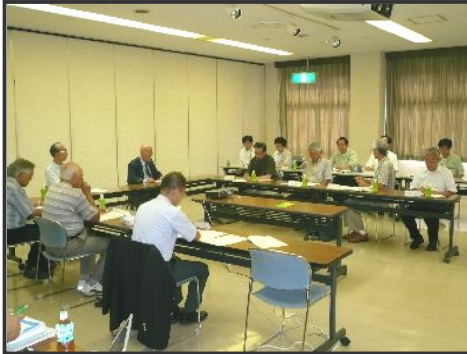
【第25回まちづくり協議会の様子】