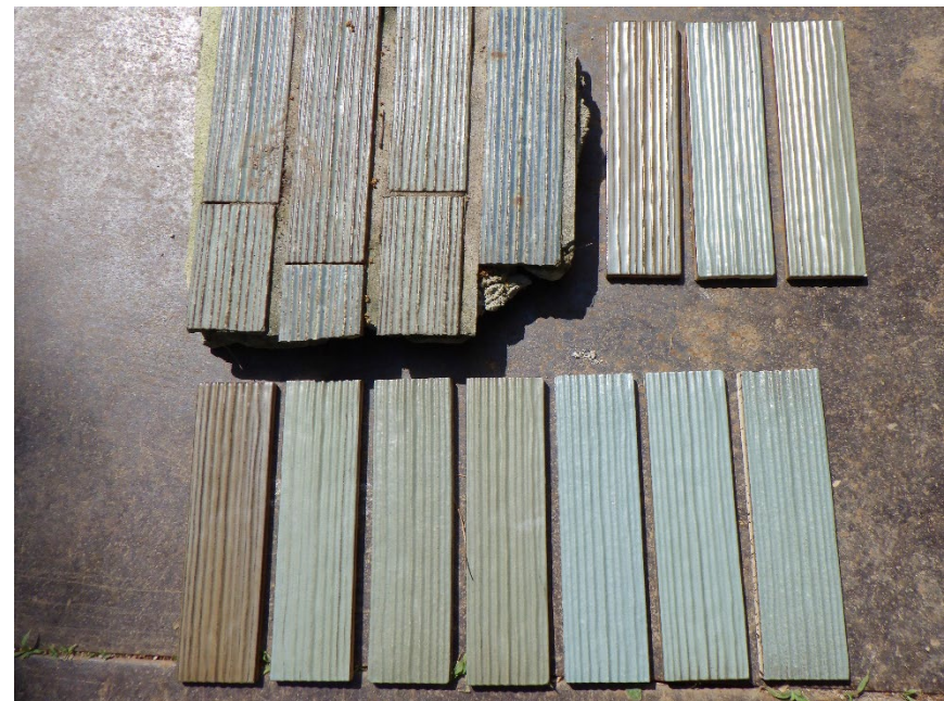
令和4年5月 既存タイルと 試作タイルの 色サンプル (検討中のもの)