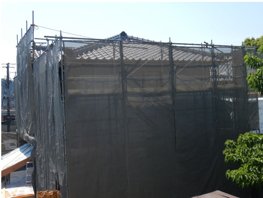
令和4年4月 屋根瓦の設置 一部鬼瓦の再利用