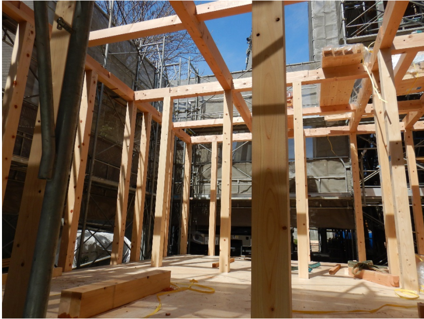
令和4年4月 木造増築部 (トイレ等) の建て方

令和4年(2022年)5月末現在、既存建物の屋根瓦の設置、木造増築部の建て方等が完了しています。