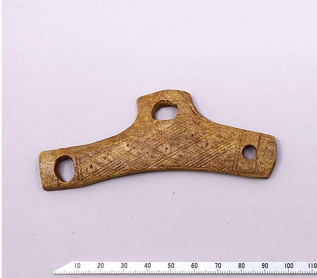
1. 由比ガ浜中世集団墓地遺跡出土