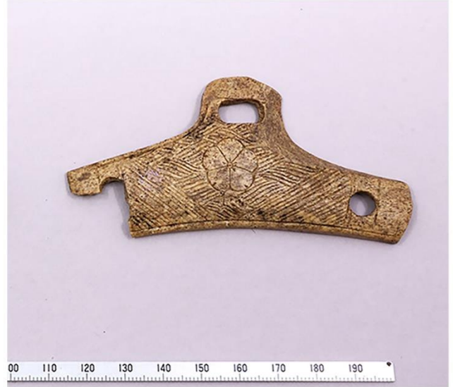
2. 由比ガ浜中世集団墓地遺跡出土