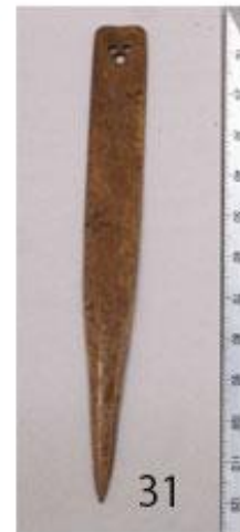
写真3. 鎌倉出土のさまざまな骨角製品2