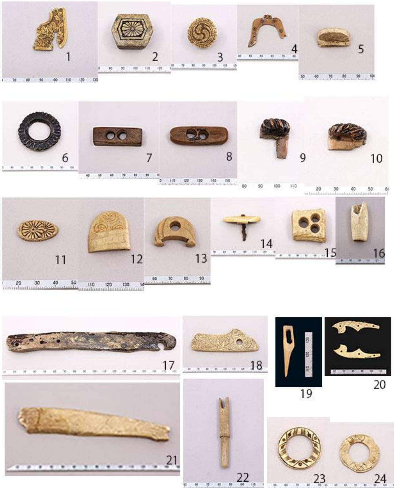
写真2. 鎌倉出土のさまざまな骨角製品1 (番号は表2に対応)