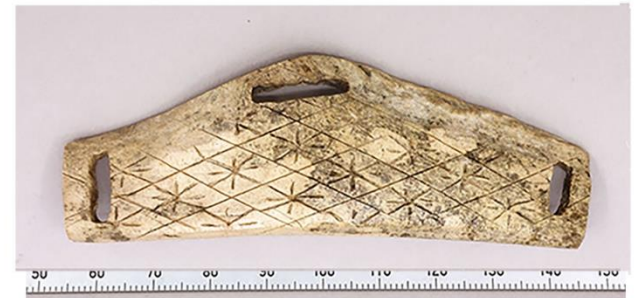
4. 若宮大路周辺遺跡(本覚寺境内遺跡)出土