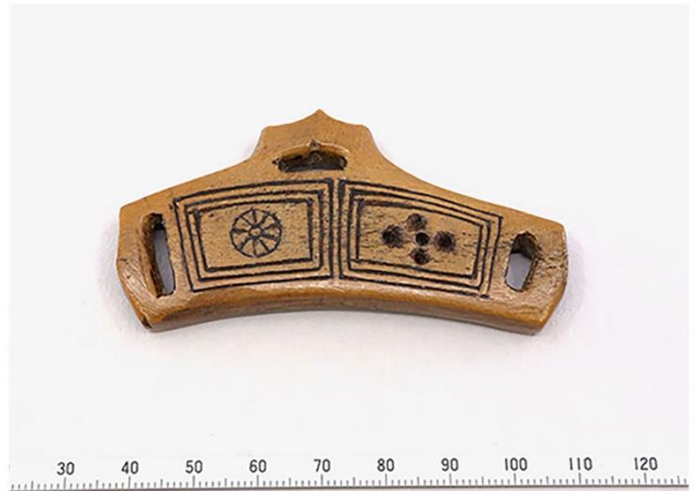
6. 若宮大路周辺遺跡出土