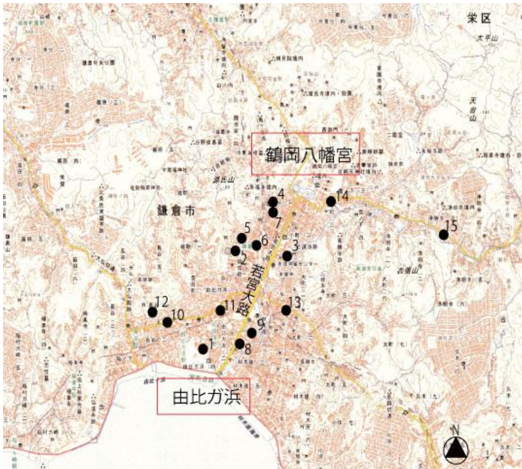
図 1. 辻具骨角製品出土遺跡位置図

鎌倉市市街地の発掘調査では生活に関わる様々な道具が出土する。膨大な量の遺物の中でも遺跡の年代決定の指標に使用される貿易陶磁器や国産陶器、かわらけなどの土器については様々な角度から研究が進められてきており、徐々にその詳細が見えてきた面も大きいと思う。一方で馬や牛、イルカやクジラなど動物の骨や角などを利用した製品や、それらを加工した後に残る残片なども多く出土することから、中世鎌倉においてそれらを生産し、供給がなされるような体制があったことは想定されるものの、断片的であり、これまでの研究の蓄積としては前者との間に大きな開きがあると言わざるを得ない。とはいえ、出土事例の増加により、鎌倉で出土する骨角製品の中に、出土すること自体が少ないといわれてきた武具や馬具の付属品が多く含まれることが確認されてきており（河野 1989・菊川 1991・2023）、再度それらを見直すことで、都市鎌倉の具体像に近づくための一助となり得ると考えている。今回はその中でも特に「辻具」として報告された（宮田 1982）ものの、その詳細については不明とされてきた資料と、同様の形状や特徴を持つ資料を集成し、出土状況と併せてその用途や骨角製品の加工、生産について若干ながら論点を整理したい。