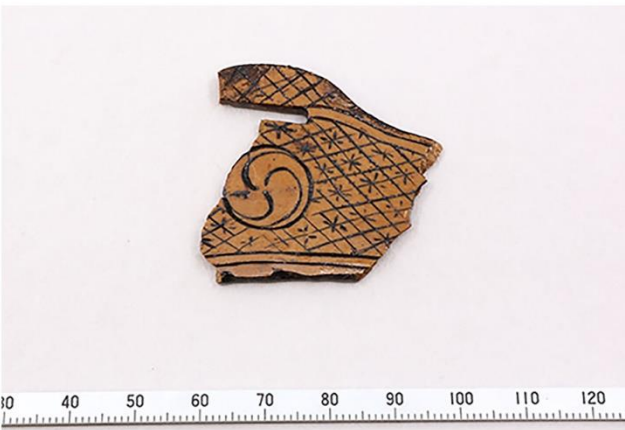
5. 若宮大路周辺遺跡出土