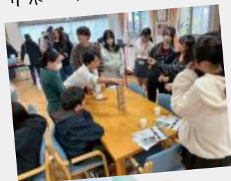
サポーター初ガース