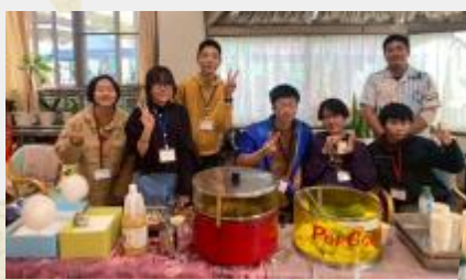
月見荘会の みんなも大活躍！