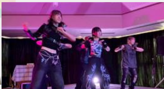
「わたしの居場所」思い思いの作品