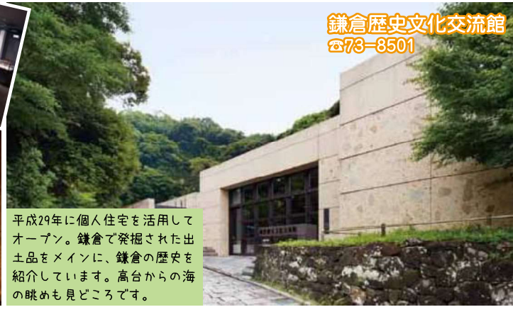
鎌倉歴史文化交流館 ☎73-8501

平成29年に個人住宅を活用してオープン。鎌倉で発掘された出土品をメインに、鎌倉の歴史を紹介しています。高台からの海の眺めも見どころです。