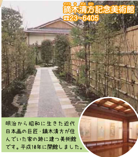
鎌倉 鋼木清方記念美術館 ☎23-6405

明治から昭和に生きた近代日本画の巨匠・鋼木清方が住んでいた家の跡に建つ美術館です。平成10年に開館しました。