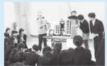
1分間で660票の投票用紙を分類する機械を実際に使用

中学生が自ら考え投票することの重要性を学ぶ場として、明るい選挙推進協議会と選挙管理委員会では、出前授業「模擬選挙」を実施しています。