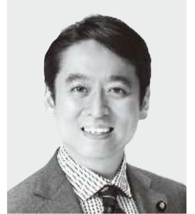
ひら 平木 だいさく 現 役職:元経済産業大臣政務官。 参院議員1期。 経歴:東京大学法学部卒。 年齢:44歳