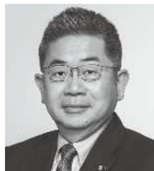
党書記局長 小池 晃 現 59歳。参院議員3期。全国革新懇代表世話人。医師。