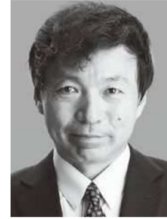
及川幸久 おいかわ ゆきひさ

ユーチューバー「及川幸久潜在意識チャンネル」、作家、国際政治コメンテーター、幸福実現党外務局長。