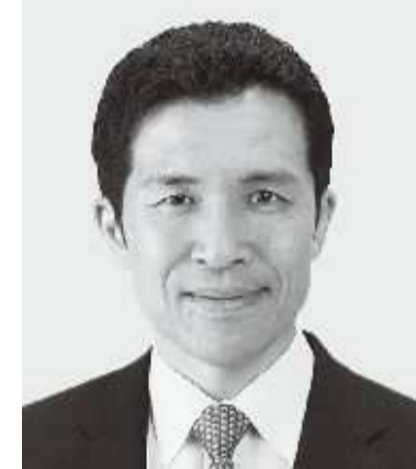
にいづま 新妻 ひでき 現 役職:元文部科学大臣政務官。 参院議員1期。 経歴:東京大学大学院修士課程修了。 年齢:48歳