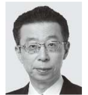
はまの よしふみ 浜野 よしふみ 参議院議員 現職 まっすぐに力強く! 働く仲間のために!