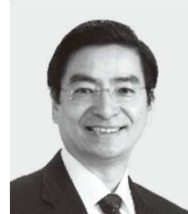
やまもと 山本 ひろし 現 役職:元財務大臣政務官。 参院議員2期。 経歴:慶應義塾大学法学部卒。 年齢:64歳