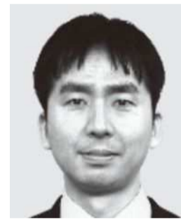
すずき さとる 鈴木 党 政党職員 新人 人への投資で将来の人材を育成