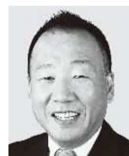
おおしま 九州男 参議院議員 現職 平和憲法の精神を守ります