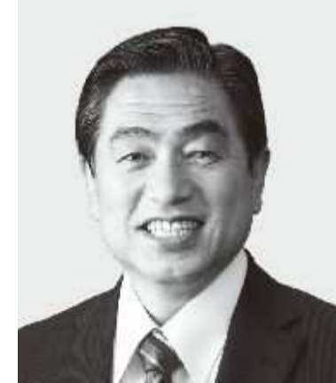
わかまつ 若松 かねしげ 現 役職:元復興副大臣。参院議員1期。 経歴:中央大学二部卒。公認会計士。 税理士。行政書士。 年齢:63歳