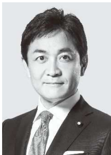
国民民主党 代表 玉木雄一郎