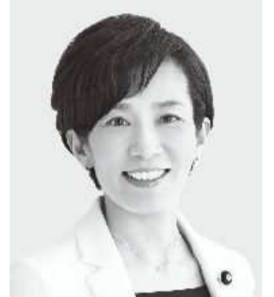
やまもと 山本 かなえ 現 役職:元厚生労働副大臣。 参院議員3期。 経歴:京都大学文学部卒。 年齢:48歳