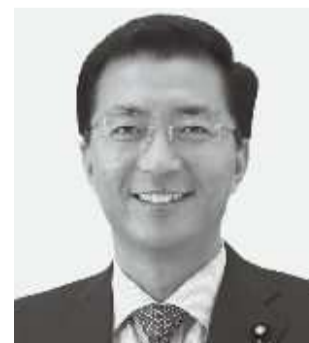
党副委員長 山下 よしき 現 59歳。参院議員3期。