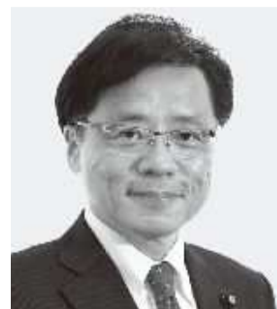
党参院幹事長・国対委員長 井上 さとし 現 61歳。参院議員3期。