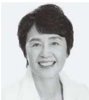
党農林・漁民局長 紙 智子 現 64歳。参院議員3期。