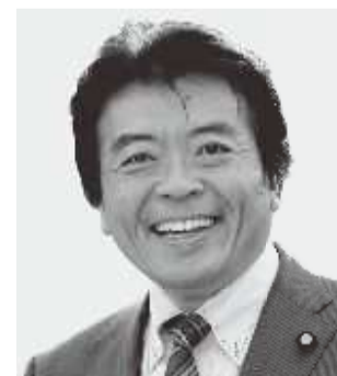
弁護士 仁比 そうへい 現 55歳。参院議員2期。党参院国対副委員長。