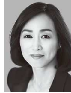
釈りょうこ しゃく

党女性局長を経て現職。2016年、国連女子差別撤廃委員会ですピーチを行う。夕刊紙連載ほか、著書に「繁栄の国づくり」など。