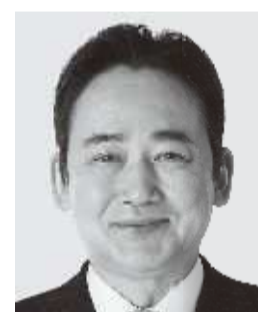
いしがみ 石上 としお 参議院議員 現職 全力で聴く。全力で届ける。全力で挑む。