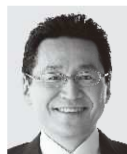
いそざき 哲史 参議院議員 現職 仲間の思い、かたちにしたい。