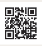
▲仕組みの解説動画