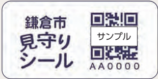
▲シールのサンプル

行方不明になった認知症の高齢者などを迅速に保護できる仕組みです。見守りシールを衣服や持ち物に貼ってる人を見かけたら、二次元コードを読み込んで、現在地の入力などご協力をお願いします。また、読み取られると同時に登録者の家族などに通知が届きます。読み取りに利用した端末の情報は一切記録されません。 詳細は同課(本庁舎1階)へ。