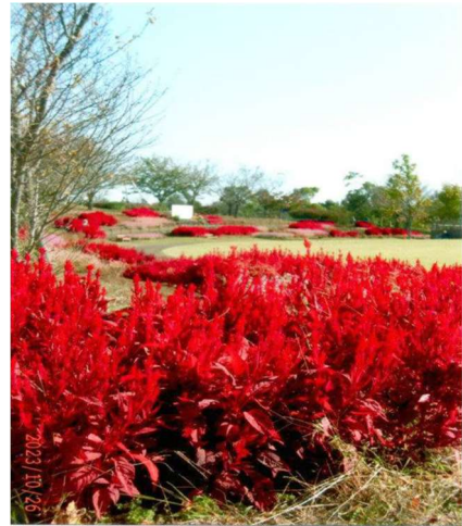
(平塚花菜ガーデン)

日 時 令和5年10月26日(木) 午前8時50分から 場 所 ①神奈川県温泉地学研究所 ②神奈川県平塚花菜ガーデン 出席者 明選会員：26名 市選挙管理委員会事務局：1名 内 容 温泉について