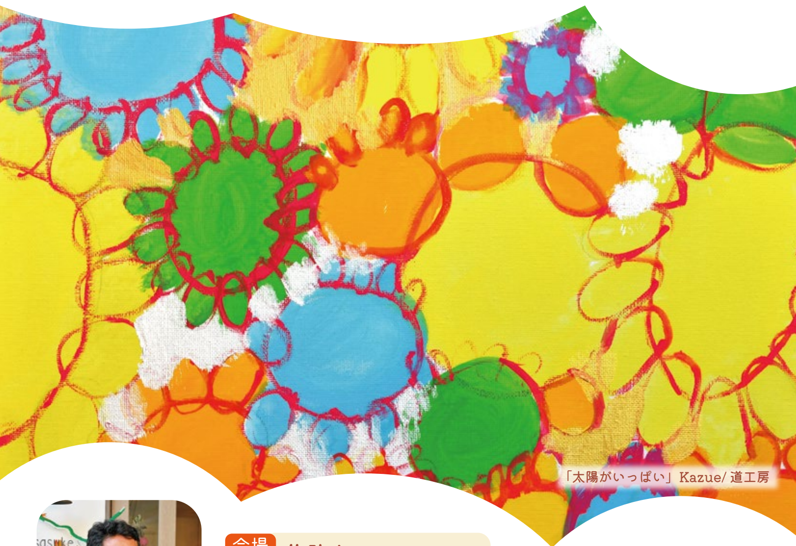
「太陽がいっぱい」Kazue/道工房