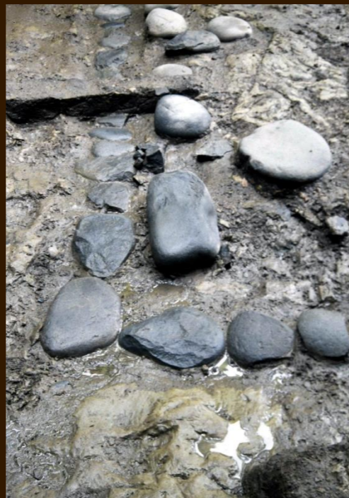
縁束の礎石と雨落ち溝

Remains of Hojo Yoshitoki's Hokkedo Buddha Hall (photo taken from the northwest during the excavation)