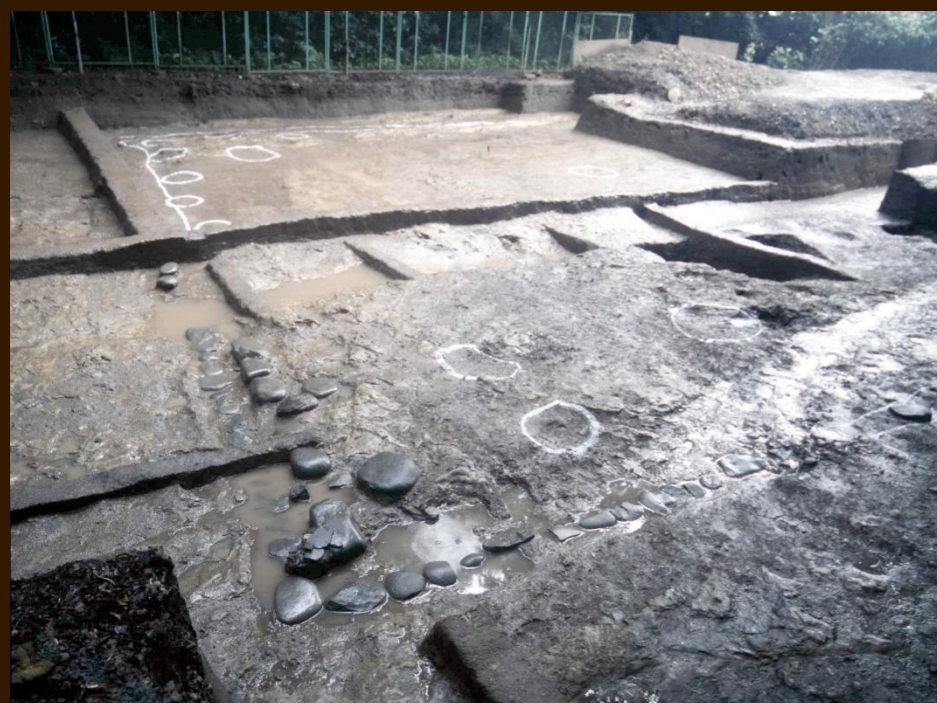
発見された建物跡（北西から）

Remains of Hojo Yoshitoki's Hokkedo Buddha Hall (photo taken from the northwest during the excavation)