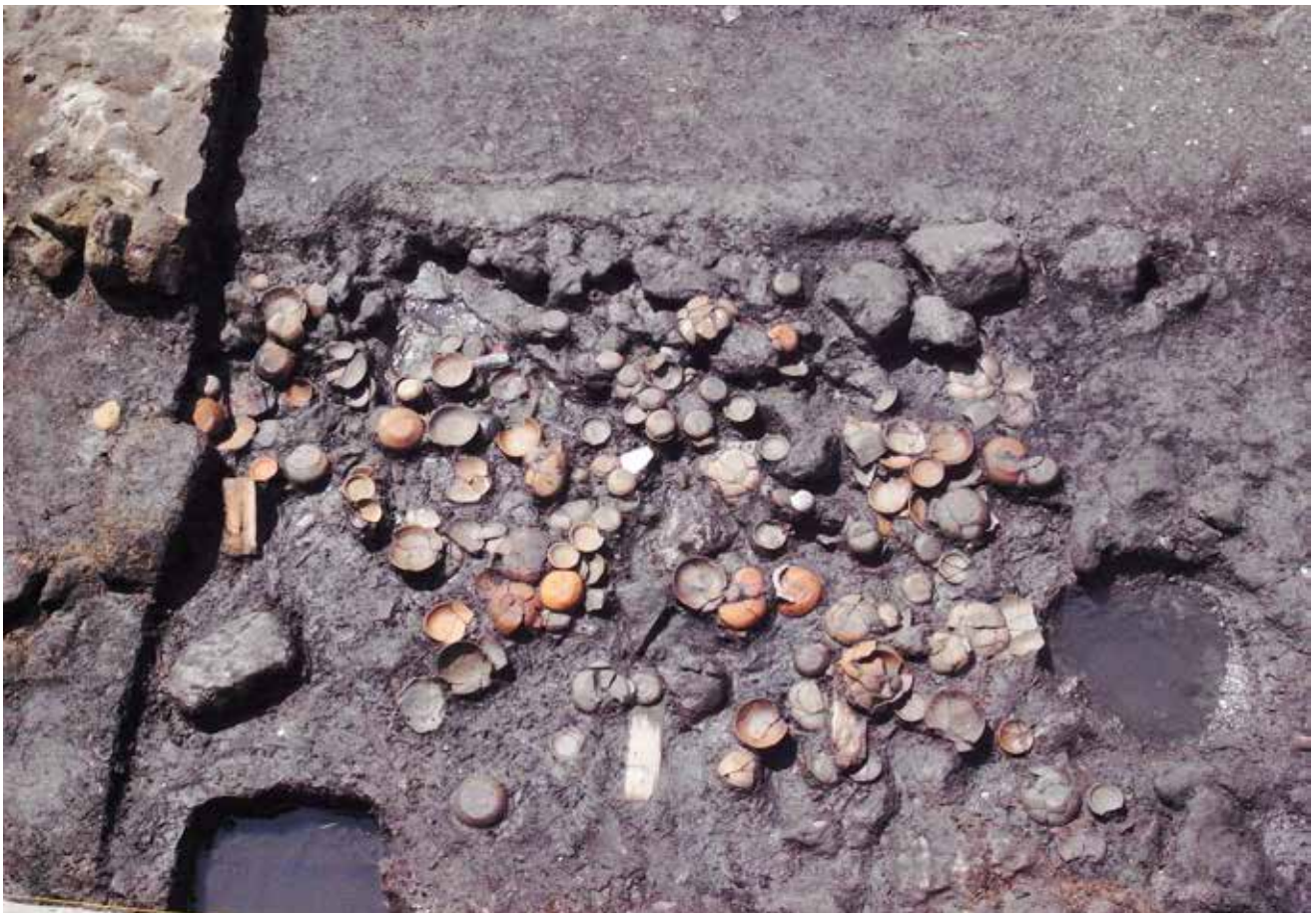
写真 12 一括出土したかわらけ(写真上、下とも) (photo12) Masses of excavated earthenware (both top and bottom photos)