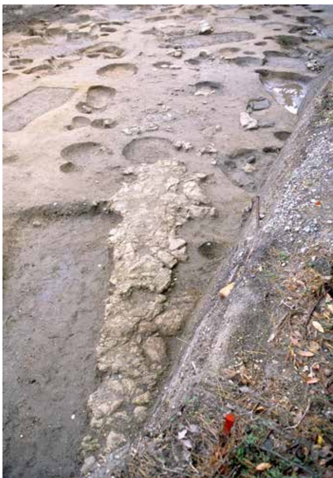
写真7 泥岩で舗装された道路 (photo7) Mudstone-paved road

鎌倉時代後期から室町時代の地層からは、数多くの柱を建てるための穴(柱穴)や、泥岩で舗装された道路の跡、庭と推定される玉石敷きも発見されています。玉石の大きさは、基石から子どもの拳ほどの大きさで、一部では 10 cm 以上の厚みがありました。また、周辺からは鬼瓦や平瓦、丸瓦が多く出土しており、瓦葺きの建物の存在が考えられます。玉石敷きの庭と瓦葺きの建物が併せて発見されたことから、寺院の跡が想定されます。調査地点周辺には新居の あらい えんまどう 閻魔堂(現在の円応寺)があったという説もあり、研究の進展が期待されます。