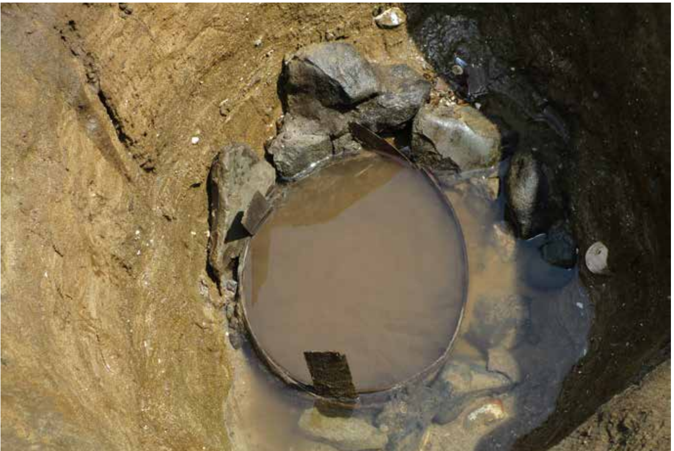
写真6 底面に曲げ物が据えられた井戸跡 (photo6) Remains of a well with a circular box at the bottom