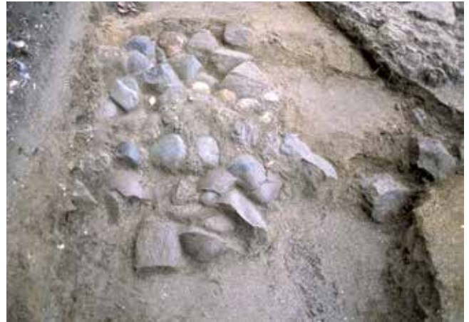
写真9 出土した玉石敷き (photo9) Excavated cobblestone pavement