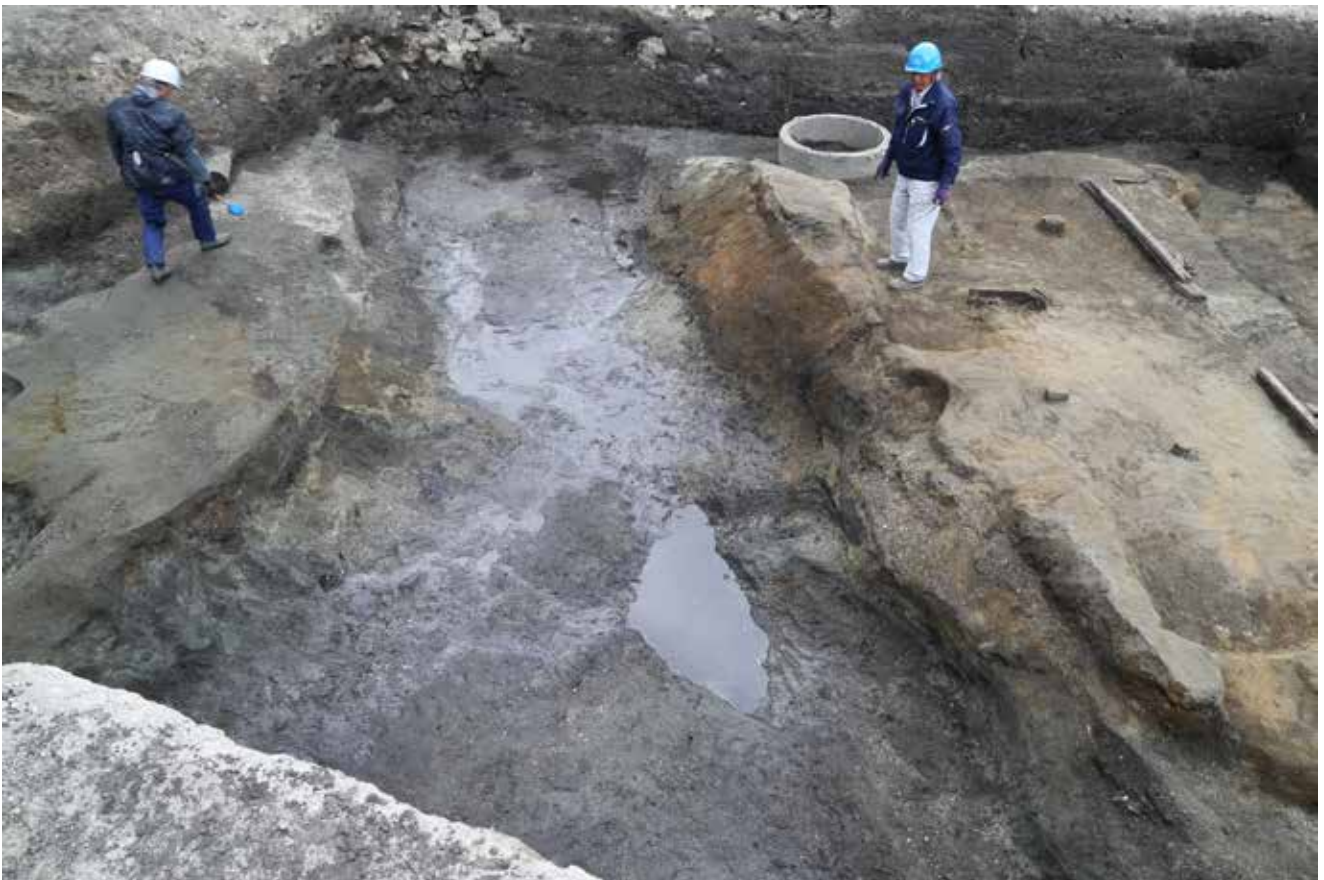
写真3 佐助川の支流と考えられる小河川 (photo3) Small river thought to be a branch of the Sasuke River