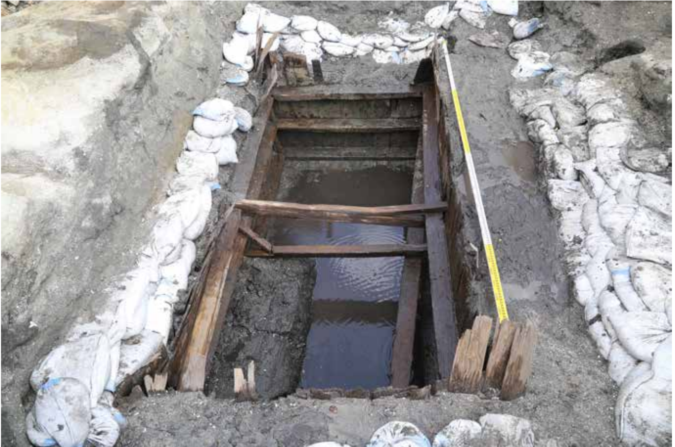
写真2 最大級の井戸跡（右のスケール長は4 m） (photo2) Largest-class well remains (the right-hand scale is 4 meters long)