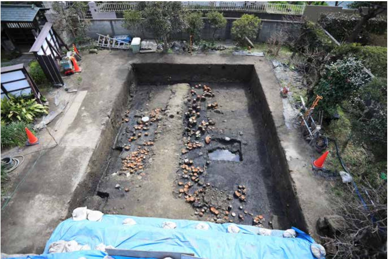
写真11 調査地点上空から（調査区中央が塀の基礎と考えられる土盛り、上が南）

調査では、塀の基礎と考えられる土盛りの両側に大量のかわらけ（土器の皿）が捨てられていました。かわらけは釉薬のかけられていない素焼きの土器で、市内の遺跡から大量に出土します。かわらけは饗宴 きょうえん の際に食器として使用され、一度口をつけると穢れ けが が移ると考えられており、一度限りの使い捨てにされたものです。このかわらけが大量に出土することは、大規模な饗宴が執り行われていた証拠です。塀の両側から出土していることは、屋敷の片隅が饗宴の後片付けの場所だったことを示しているのかもしれません。