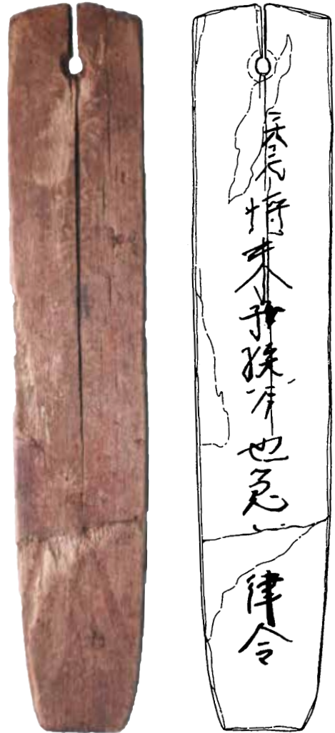
出展：1991年 鎌倉市教育委員会発行 『鎌倉市埋蔵文化財緊急調査報告書7』

この札は、上部に穴があり、建物の柱などに打ち付けられていた痕跡があります。また墨書きがされた部分は浮かび上がり、他の木の部分は日光によって痩せていることから、日当たりのよいところに長期間置かれていたことが分かります。疫病から逃れるため「蘇民将来の子孫の家」であることを表示し、何年もの間玄関や門扉に打ち付けられていたのでしょう。この木札は、600年以上前に鎌倉に住んだ人々が、何とかして疫病に打ち勝とうとしていたことがわかる出土資料です。