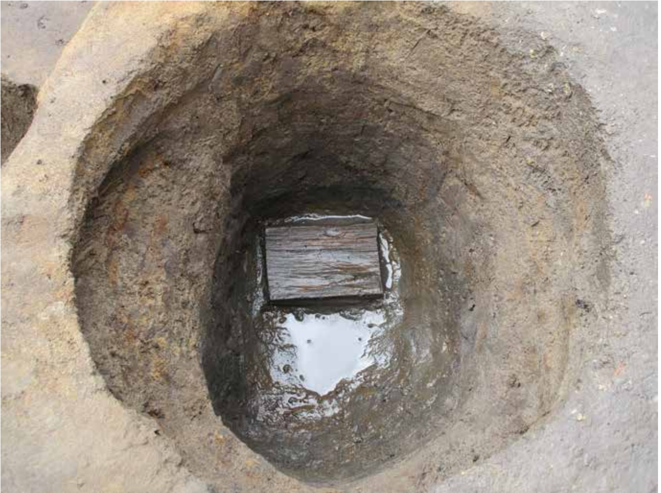
写真5 礎板が残る柱穴 (photo5) Posthole with remaining foundation plate