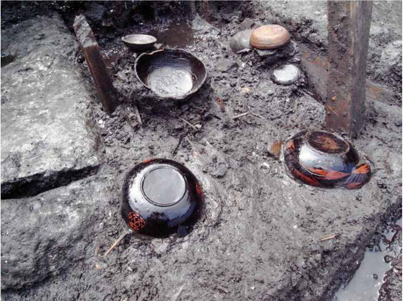
写真14 漆器の出土状況 (photo14) Lacquerware as excavated