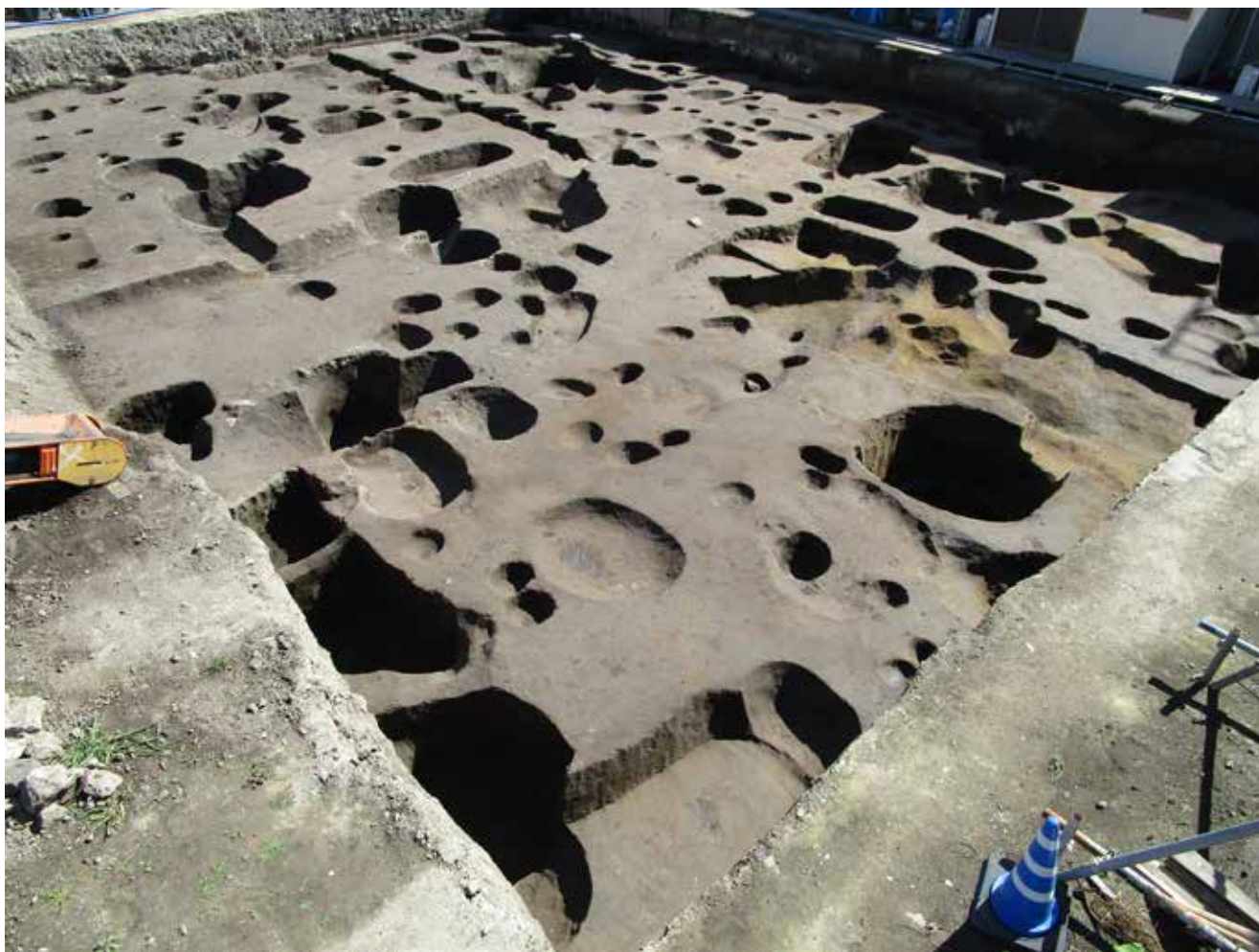
写真4 発見された柱の穴や井戸の跡

調査区西側では、後世の掘削により遺跡が大きく壊されており、詳細は判然としませんでした。しかし、鎌倉時代前期（13世紀前半）と推定される地層からは、若宮大路と軸を揃えた掘立柱建物や、半地下式の倉庫と考えられる建物、井戸などが発見されています。建物跡では、柱の沈下防止のために柱の底に据えられた礎板と呼ばれる板材が発見されています。これらの建物跡が宇津宮辻子幕府の一部であるとは即断できませんが、今後の研究のための貴重な調査例です。