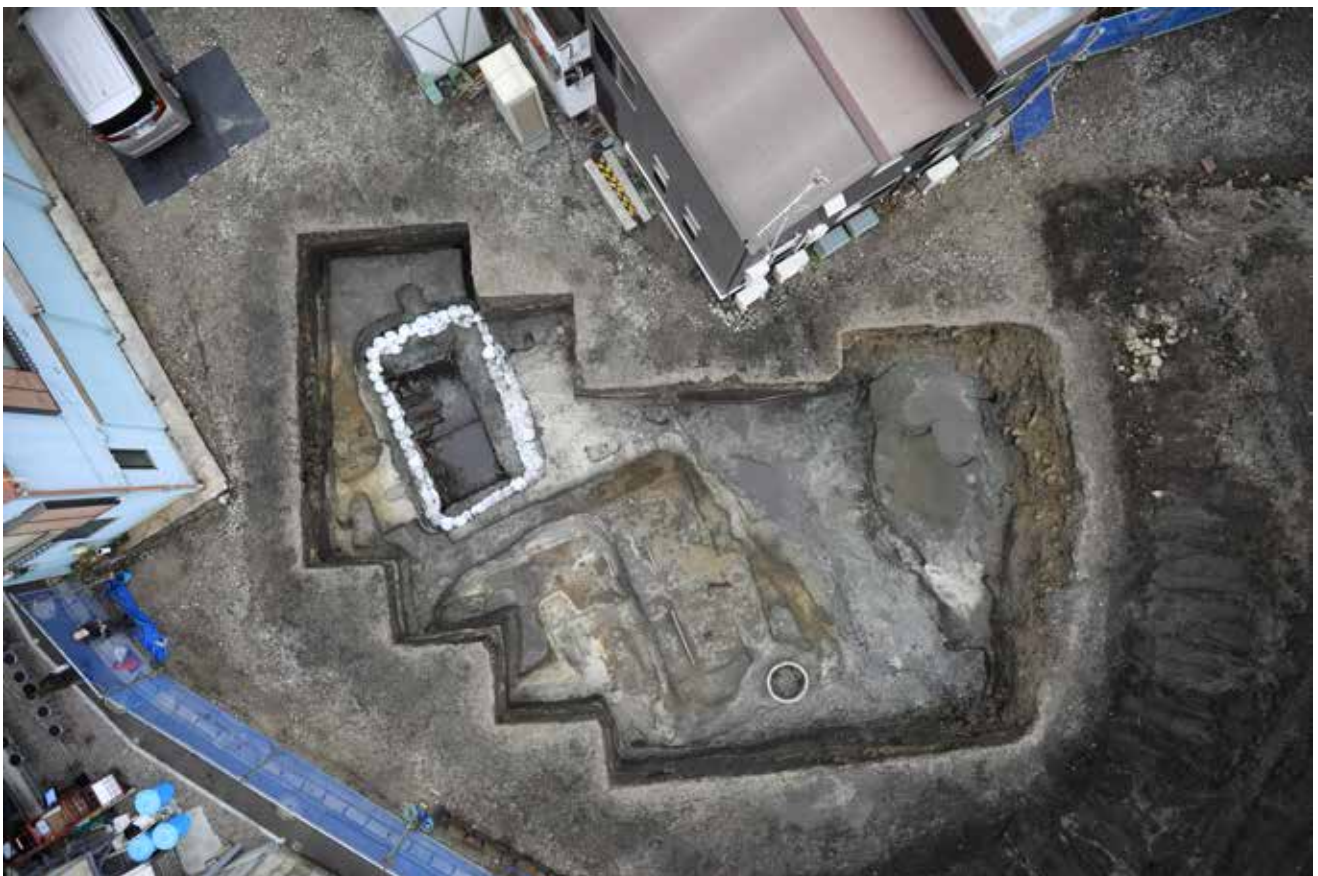
写真1 調査地上空から (白く囲まれた範囲が井戸跡、上が東)

この調査地点は、JR 鎌倉駅から南へ延びる御成通りの南端部西側に位置し、調査地点の西側には佐助川が流れています。今回の発掘調査によって鎌倉時代の半地下式の建物や佐助川の支流と考えられる小河川等が発見されました。中でも注目されるのは、短辺約 2 m、長辺約 4 m の長方形の井戸で、全国的に見ても最大級の井戸の発見例です。また市内で発見される中世の井戸は、正方形であることが一般的であるのに対し、この井戸は長方形に作られています。井戸の深さは 2.6 m まで確認することが出来ましたが、崩落の危険があったため、より深い部分の調査は断念しています。これだけ大きな井戸であれば、染色等の手工業に係る用途があったのかもしれませんが、当該地域の性格を考えるうえで貴重な成果です。