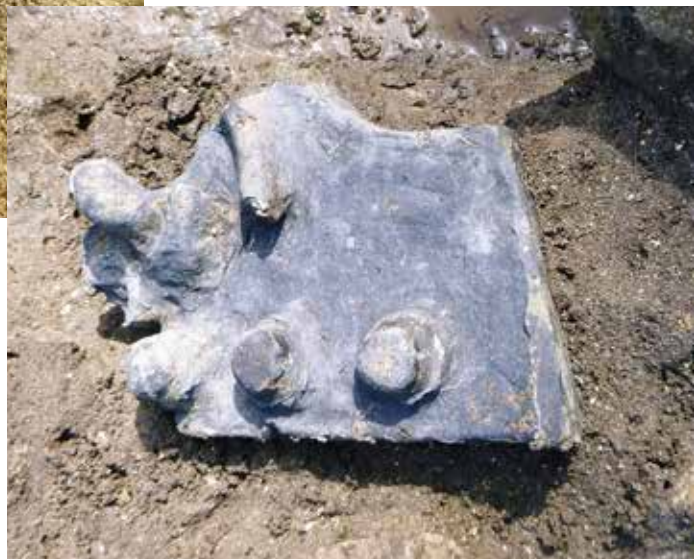
写真10 軒平瓦 (上) と鬼瓦 (右) (photo10) Eave-end roof tile (top) and ridge-end tile (right)