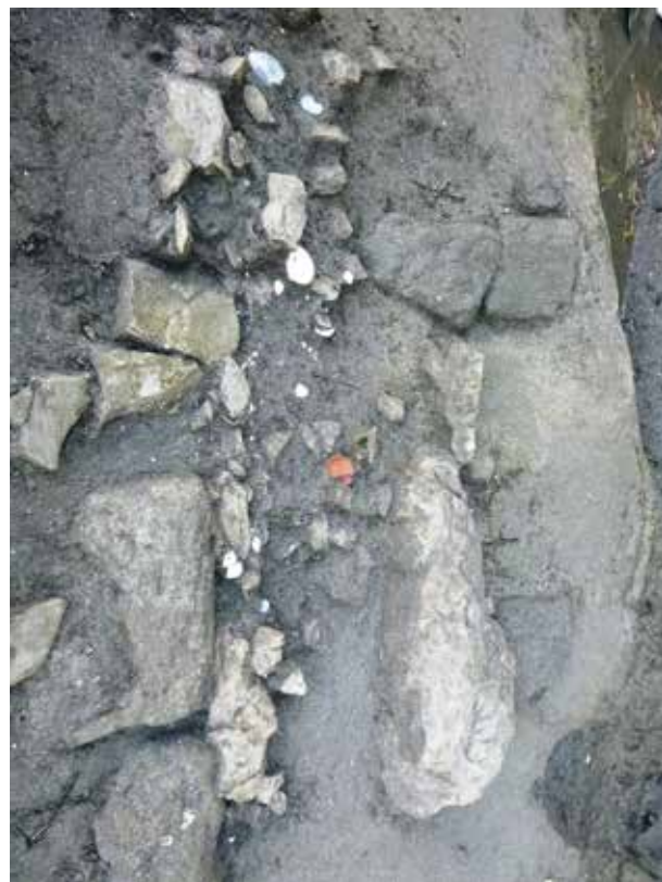
写真8 石組みで造られた道路の側溝 (photo8) Roadside gutters made of stonework