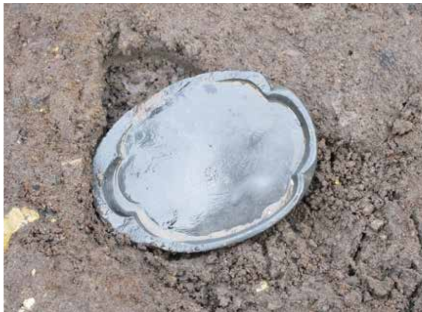
写真16 宇津宮辻子幕府跡(小町二丁目351番、352番地点)出土の硯 (photo16) Inkstone excavated from Utsunomiya-Zushi-Bakufu-Ato Site (Komachi 2-351 and 352)

Panels with India-ink writing on them have also been excavated, which seem to have traces of brush breaking-in or brush-writing exercises. These panels were originally thin wooden tableware trays called "orishiki." At the time of a feast, these trays were used to carry karawake earthenware and other items. These panels have dense India-ink writing on both sides, but the characters are not distinctly written and the contents are not clear.