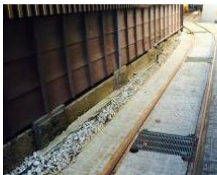
写真2-83 トロッコ用レール