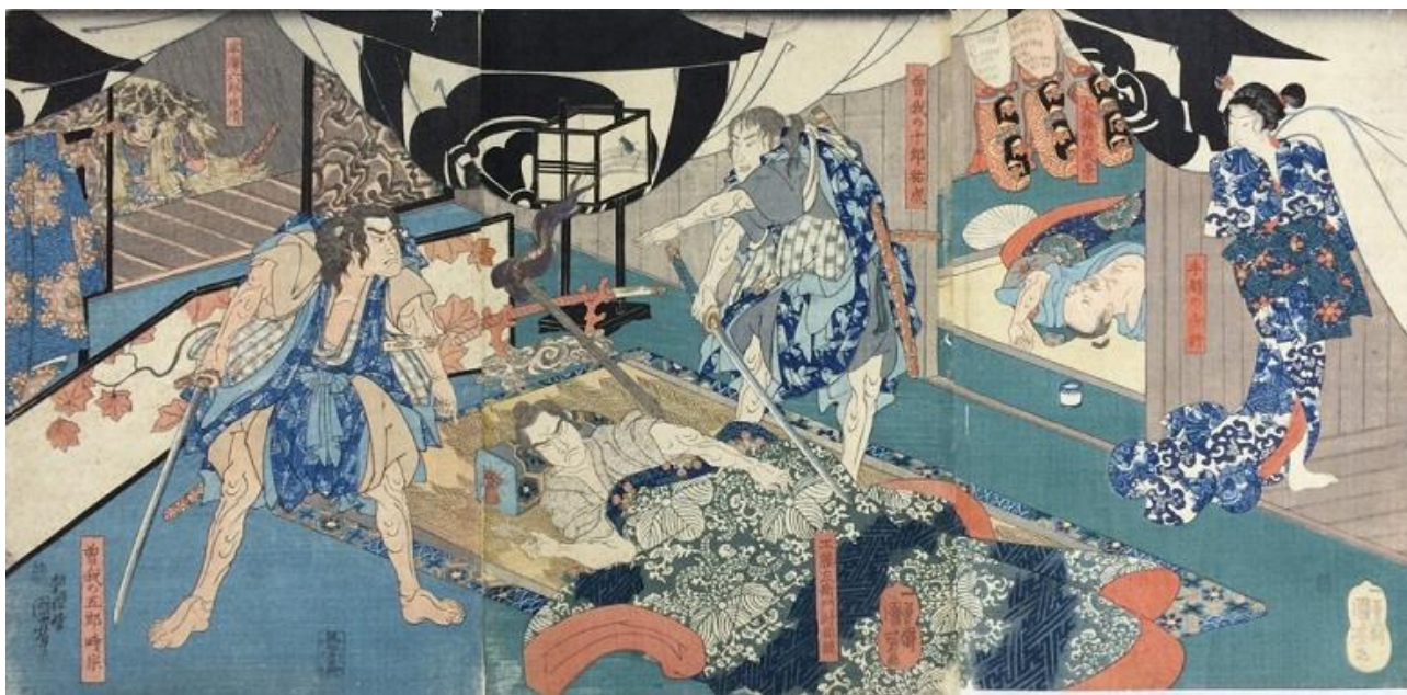
図2-13 曾我物語を題材とした錦絵

そして江戸時代、泰平の世が続く中、鎌倉は、現在も知られる浄瑠璃、歌舞伎の代表的な演目の舞台として取り上げられるようになった。鎌倉時代の曾我兄弟の仇討 あだうち を題材とする「寿曾我対面 ことぶきそがのたいめん 」などで舞台となるほか、「仮名手本忠臣蔵 かなでほんちゆうしんぐら 」のように江戸幕府をはばかって舞台を江戸から鎌倉へ置き換えて上演するものも多く、これらを通じて庶民に知られる場所となり、社寺も信仰の対象としてのみならず、江の島など景勝地の見物と結びついて遊山の対象となりはじめる。こうして鎌倉には江戸やその近郊から武士や町人など多くの遊山客が訪れることとなり、さらに賑わいを取り戻していくこととなる。