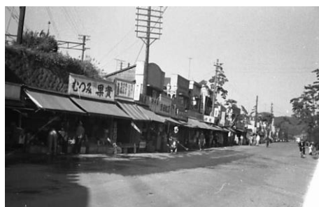
写真2-78 若宮大路 (昭和34年(1959年))