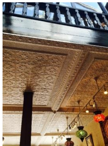
写真2-81 店舗天井・吹抜

鶴岡八幡宮への参拝客などで賑わう若宮大路において、昭和初期の風情を湛えるこの建物は、行き交う人々の目を