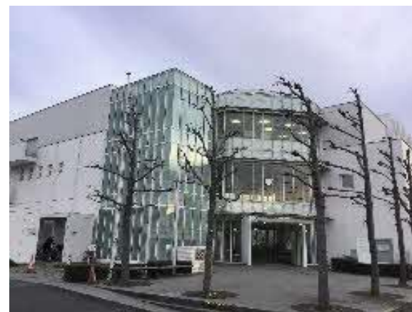
腰越学習センター