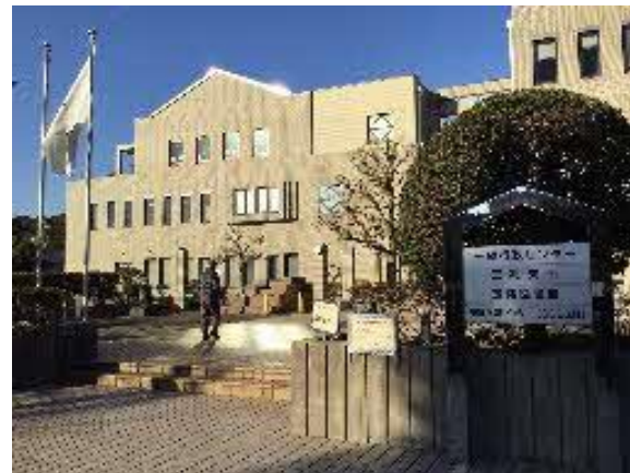
玉縄学習センターおよび分室