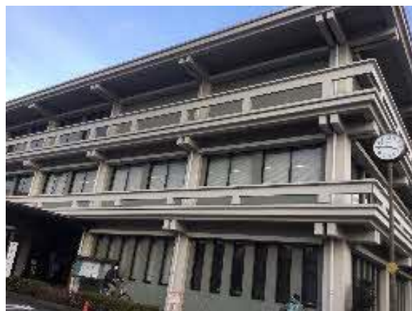
深沢学習センター