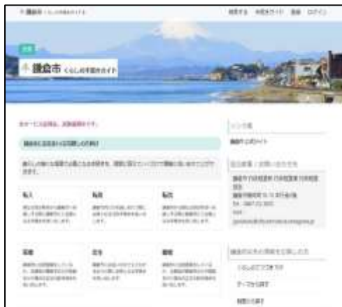
「鎌倉市 暮らしの手続きガイド」トップページ

現行の市ホームページでは、ライフイベントごとに、自分に必要な手続きが何かを自分で検索する必要がありますが、本ガイドを利用すると、簡単な質問に答えるだけで必要な手続き（アクション）を知ることができます。