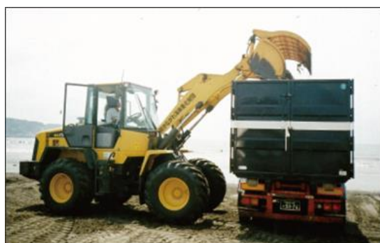
かながわ海岸美化財団 による清掃作業

海岸のごみは、ほとんどが漂着ごみで、河川への投棄物が海岸に流れ着いたものです。これらのごみは、可燃・不燃ごみに分別して処理し、海藻は海岸に埋めています。