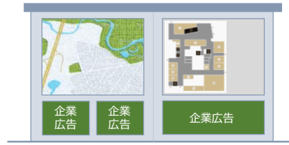
広告付き地域マップ