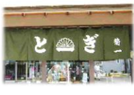
平成21年 景観づくり賞 「素敵なかんぱん」