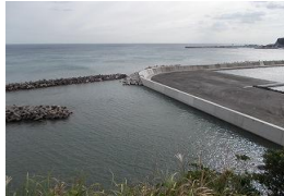
平成26年に完成した腰越漁港