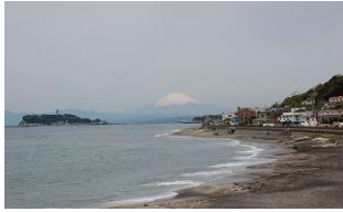
稲村方崎から望む富士山