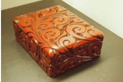
特産の彫刻漆器「鎌倉彫」