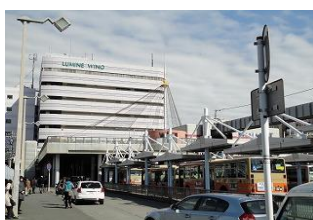
大船駅東口交通広場