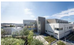
由比ガ浜こどもセンター (平成29年9月14日竣工)