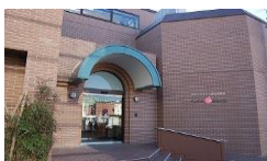
ティアラかまくら