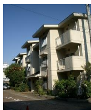
市営住宅 諏訪ヶ谷ハイム