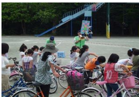
小学生対象の自転車教室