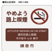
路上喫煙マナーアップ看板