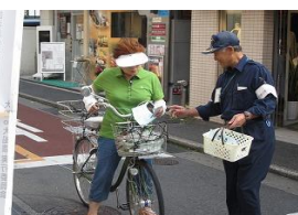
放置自転車クリーン対策キャンペーン