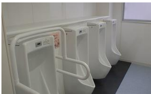
西鎌倉小学校 トイレ改修

◆この施策にかかる経費( )は前年度データ 4億7,775万円 ※全体予算に占める割合 (16億4,960万円) … 0.42% (1.45%)