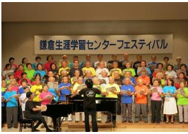
生涯学習 フェスティバル