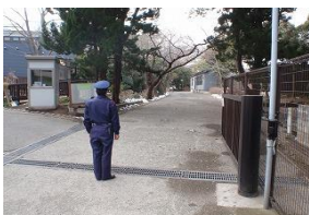
小学校における 警備員の配置