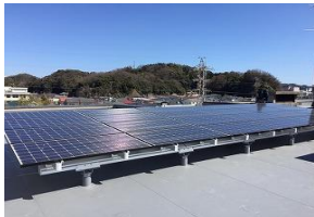
玉縄行政センター太陽光発電設備