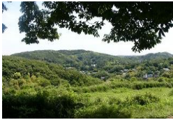
台峯(台)からの眺望