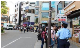
ゴールデンウィークの江ノ電鎌倉駅混雑の様子