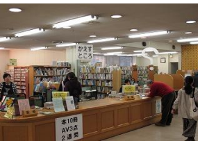
鎌倉中央図書館 の様子