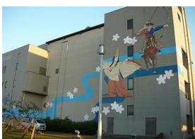
山崎浄化センター