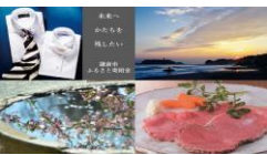
鎌倉市ふるさと寄附金

◆この施策にかかる経費( )は前年度データ 176億7,101万円 ※全体予算に占める割合 (162億8,818万円) … 15.45% (14.32%)