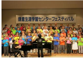
生涯学習 フェスティバル

◆この施策にかかる経費( )は前年度データ 4,348万円 ※全体予算に占める割合 (4,905万円) … 0.04% (0.05%)