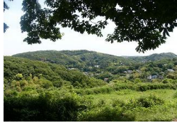
台峯(台)からの眺望