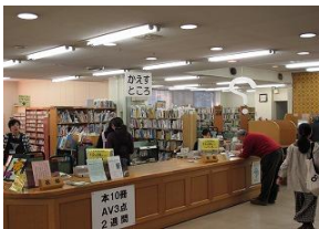
鎌倉中央図書館 の様子

◆この施策にかかる経費( )は前年度データ 6億8,469万円 ※全体予算に占める割合 (5億3,768万円) … 0.63% (0.50%)