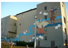
山崎浄化センター