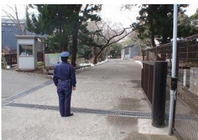
小学校における 警備員の配置

◆この施策にかかる経費( )は前年度データ 3億1,580万円 ※全体予算に占める割合 (3億1,330万円) …0.29%(0.29%)