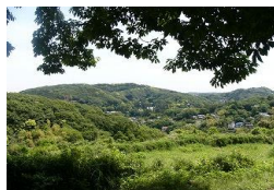
台峯(台)からの眺望