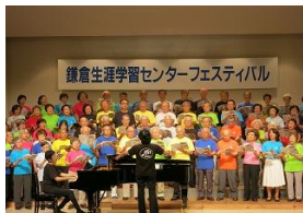
生涯学習 フェスティバル