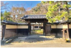
旧村上邸の活用開始