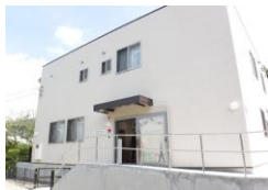
放課後子どもひろば ふかさわ・ ふかさわ子どもの家 「すずめ」

◆この施策にかかる経費( )は前年度データ 5億2,416万円 ※全体予算に占める割合 (5億3,983万円) …0.48%(0.50%)