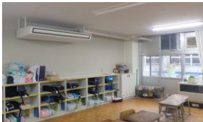
山崎小学校 普通教室冷房設備