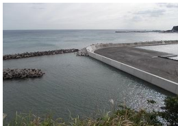
平成26年に完成した腰越漁港