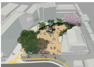
鎌倉駅西口駅前広場