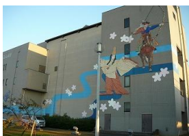
山崎浄化センター