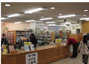
鎌倉中央図書館 の様子