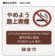
路上喫煙マナーアップ看板