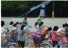
小学生対象の自転車教室