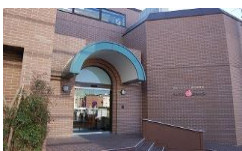
ティアラかまくら