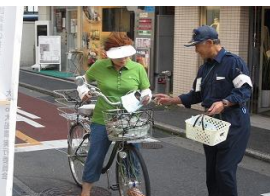
放置自転車クリーン対策キャンペーン