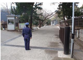
小学校における 警備員の配置

◆この施策にかかる経費( )は前年度データ 3億1,580万円 ※全体予算に占める割合 (3億1,330万円) …0.29%(0.29%)