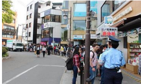
ゴールデンウィークの江ノ電鎌倉駅混雑の様子