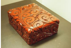
特産の彫刻漆器「鎌倉彫」