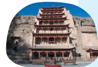
敦煌市(中華人民共和国)