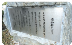
昭和33年8月10日 鎌倉市

日本国憲法を貫く平和精神に基いて、核兵器の禁止と世界恒久平和の確立のために、全世界の人々と相協力してその実現を期する。多くの歴史的遺跡と文化的遺産を持つ鎌倉市は、ここに永久に平和都市であることを宣言する。