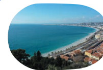
ニース市(フランス)