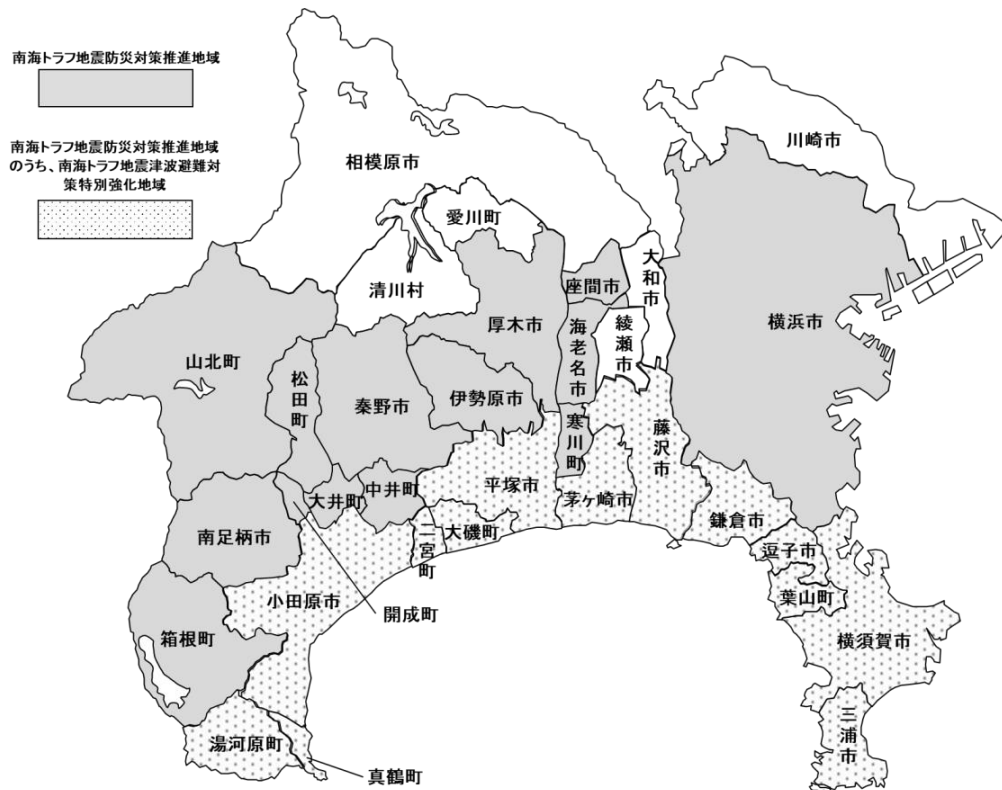
図 南海トラフ地震防災対策推進地域及び南海トラフ地震津波避難対策特別強化地域

本市は、「南海トラフ地震防災対策推進地域」（南海トラフ特措法第三条）及び「南海トラフ地震津波避難対策特別強化地域」（南海トラフ特措法第十条）に指定されています。