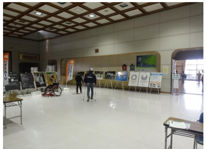
2階の関所の周り(ノルディックウォーキングパネル展示、車椅子)