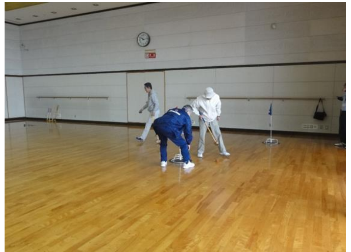
室内グラウンドゴルフ