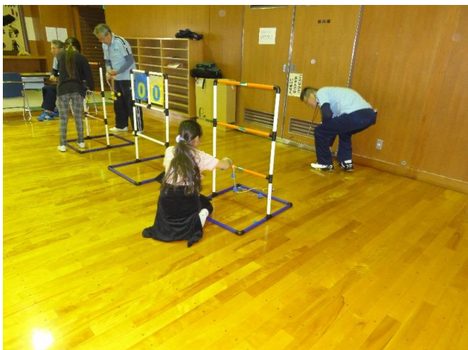
チャレンジザゲーム