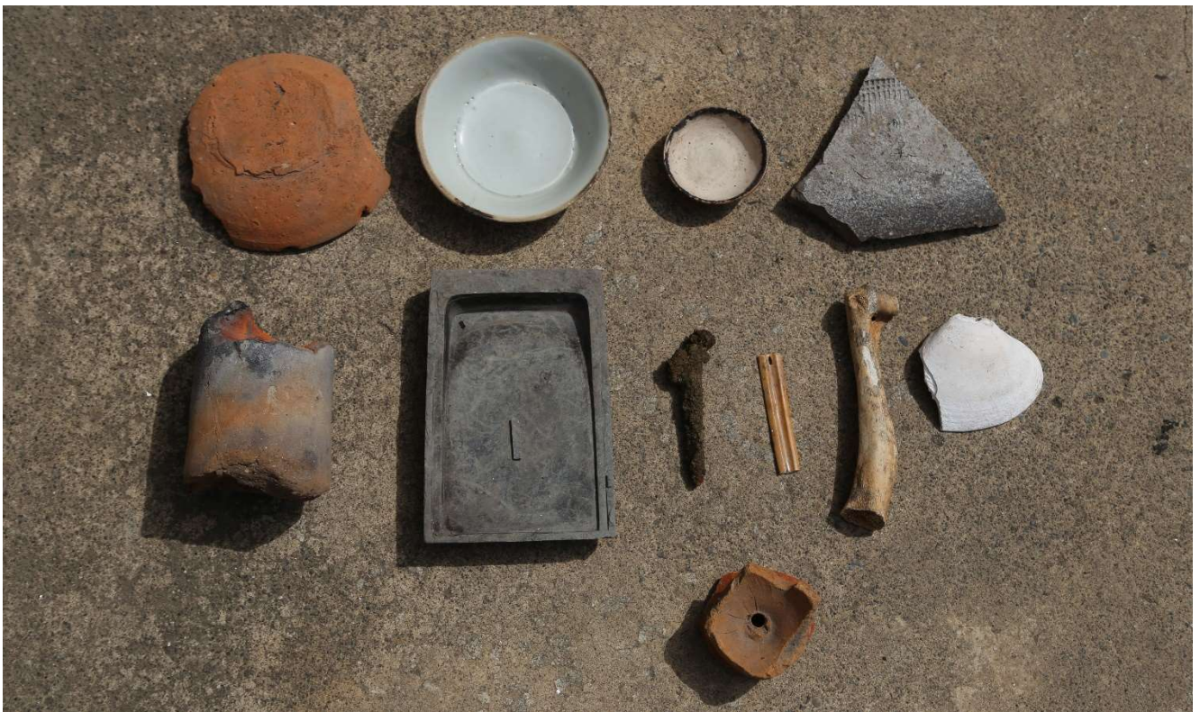
写真 13 主な出土遺物（上段左から、かわらけ、白磁皿、瀬戸入れ子、常滑甕、中段左から、ふいごの羽口、硯、鉄製釘、骨製筭、動物骨（上腕骨、犬か）、貝（ハマグリ）、下段用途不明の土製品）

(photo12) Entire research area. The large square hole is the trace of the half-underground building