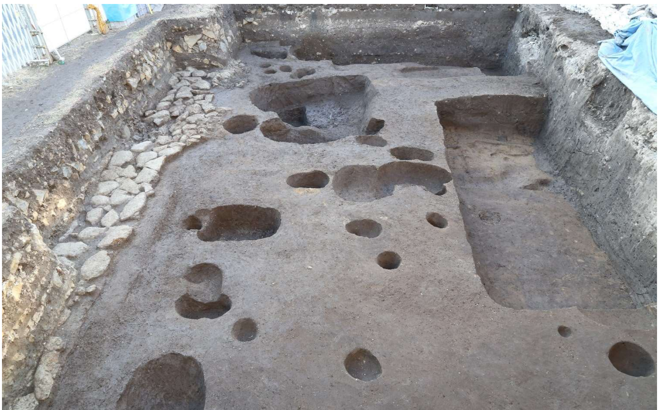
写真 11 調査区全景写真（東から） 写真左側の泥岩列が鎌倉時代の道路跡

本調査地点で発見された鎌倉時代の道路は、人頭大の泥岩を突き固めて造られています。調査区の南側を走る現市道とほぼ同様の方向に走っており、鎌倉時代の道筋が今日まで継承されていることが分かります。この調査地点からは、かわらけや常滑や瀬戸で生産された国産陶器、中国から輸入された青磁や白磁などが出土しています。また、ふいご（鞴）の羽口と呼ばれる、金属生産に使われる道具も出土しています。金属加工の際、金属を溶かす熔解炉や、鋼を生成するための製錬炉に風を送る道具がふいごで、送風管を炉に接続する際、用いられるのがふいごの羽口です。炉は 1000 度以上の高温になるものもあり、そこに接する羽口の先端は焦げて、黒褐色に変色しています。