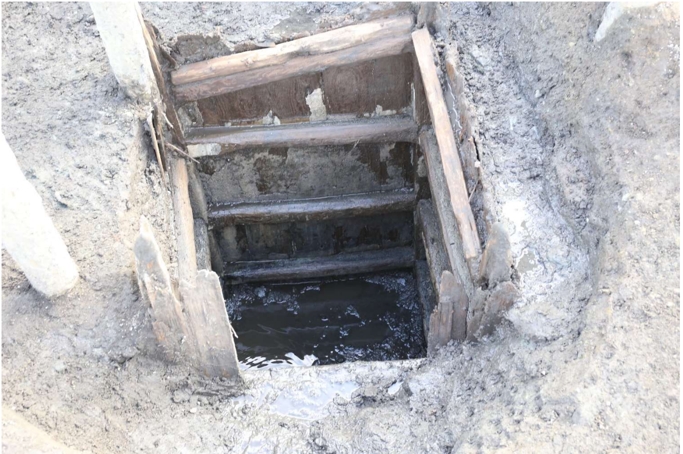
写真3 発見された井戸跡 木組みの井戸枠と水漏れ防止に塗られた漆喰 しっくい が残る (photo3) Discovered remains of the well. Wooden well-framework and plaster covered for preventing water are left