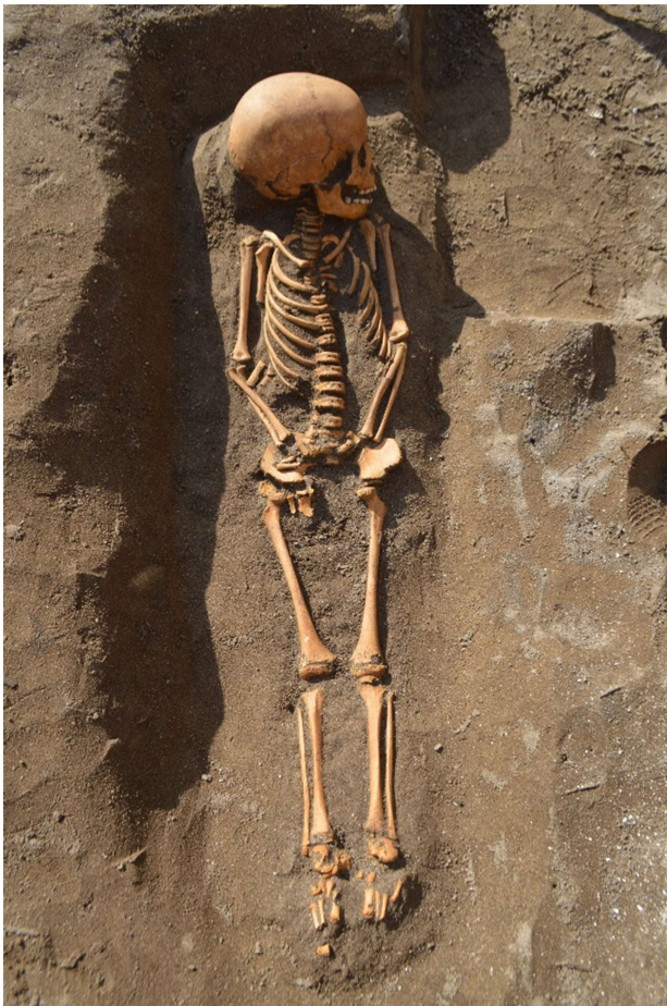
写真 15 1号人骨出土状況