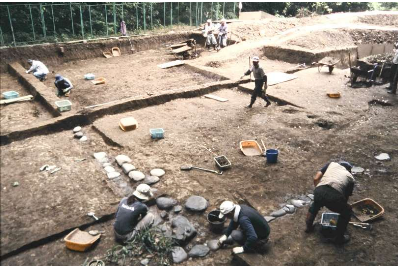
写真 17 北条義時法華堂跡調査風景 (photo17) Research scene of Hojyo-Yoshitoki-Hokkedo-Ato

unknown. The buried period is estimated to be in 9 to 10 centuries.