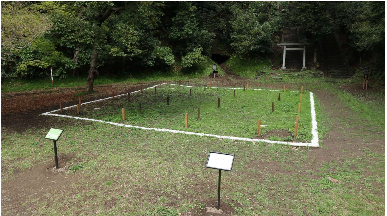
写真1 北条義時法華堂跡の遺構表示 発掘調査で発見された建物の範囲を示しています (photo1) Site display of Hojyo-Yoshitoki-Hokkedo-Ato. The range of the building discovered through the excavation research is shown

現在、現地では発掘調査成果に基づき建物範囲を表示しており、ARによる建物の復元を体験することができます。