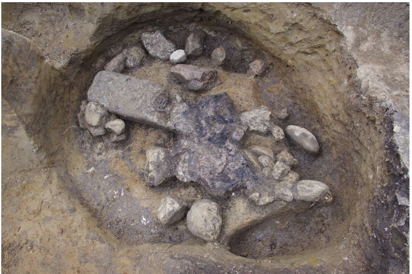
写真 9 灰や焼土が埋められた大型の穴

(photo8) Horse bone buried in a narrow hole