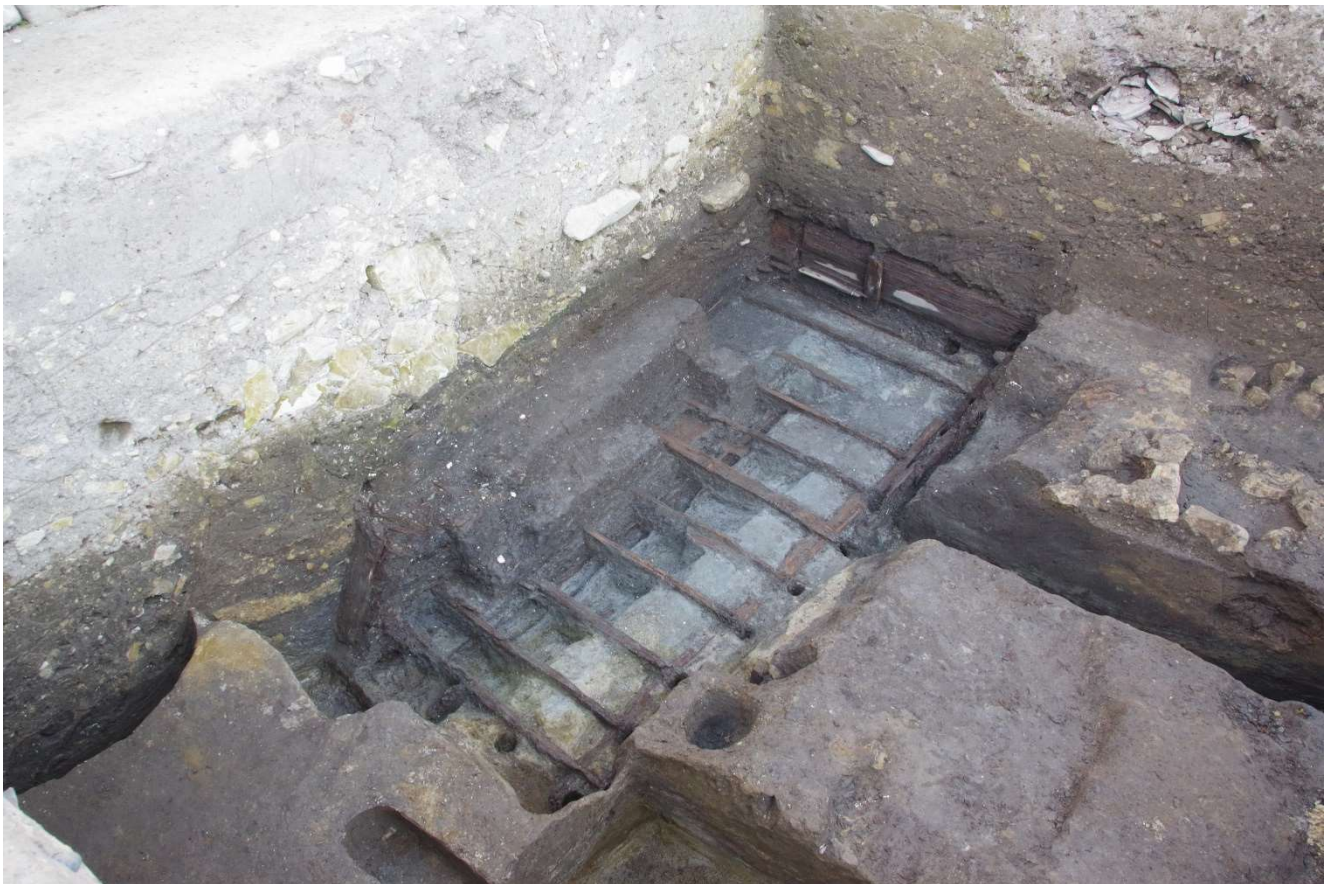
写真7 木組みが残る半地下式の建物跡

夷堂橋の北方約150mの小町大路の東に面した調査地点では、鎌倉時代の13世紀中頃から室町時代の15世紀頃の建物跡などを確認しました。砂地だったところに、細かい泥岩片を使用した整地を部分的に繰り返し、土坑、竪穴建物等を掘り込んでいました。土坑の中や整地面の上で動物の骨が多数出土しています。細長い穴に投げ込まれたような状態の馬の骨や、馬の体の一部を埋めた穴も見つかりました。銅銭やかわらけが近くに置かれる場合もあり、祭祀の痕跡かもしれません。焼土や炭、灰が詰まった大型の穴が発見されています。半地下式の建物からは細かく切断した鹿の角が出土し、この場所で動物の骨を加工する作業を行っていた可能性があります。他にも、建築部材が残る建物が見つかりました。壁や床の部材が良く残り、建物が取り壊される時に、壁板が中に倒れ込んだ状態で埋まっていました。かわらけ、常滑や古瀬戸で生産された国産陶器、中国産磁器、砥石、硯の原石、水晶の原石、加工痕のある動物骨、土錘等が比較的多く出土しており、何らかの生産活動が行われた工房であった可能性があります。