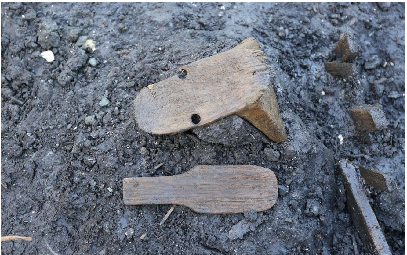
写真4 高下駄としゃもじの出土状況 (photo4) A tall wooden clog and a rice scoop as excavated