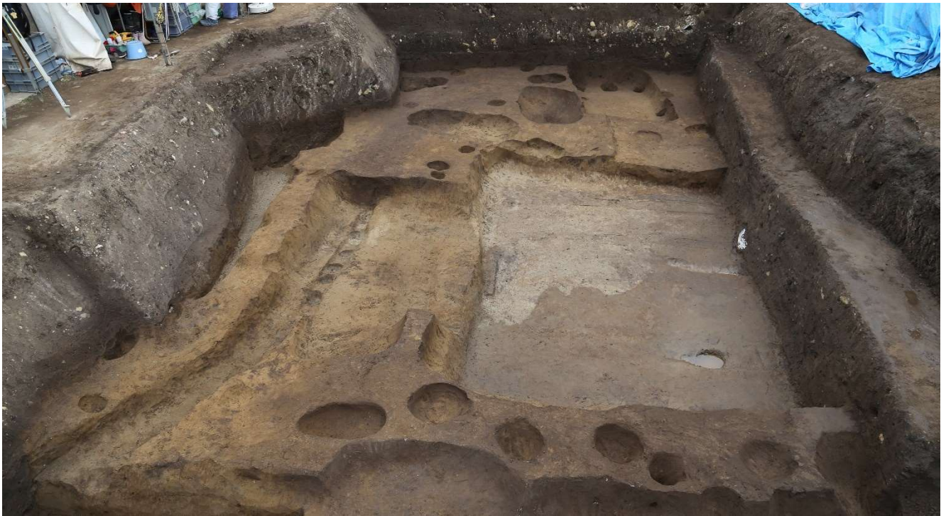
写真 12 調査区全景写真 四角い大きな穴は半地下式の建物の痕跡

(photo12) Entire research area. The large square hole is the trace of the half-underground building