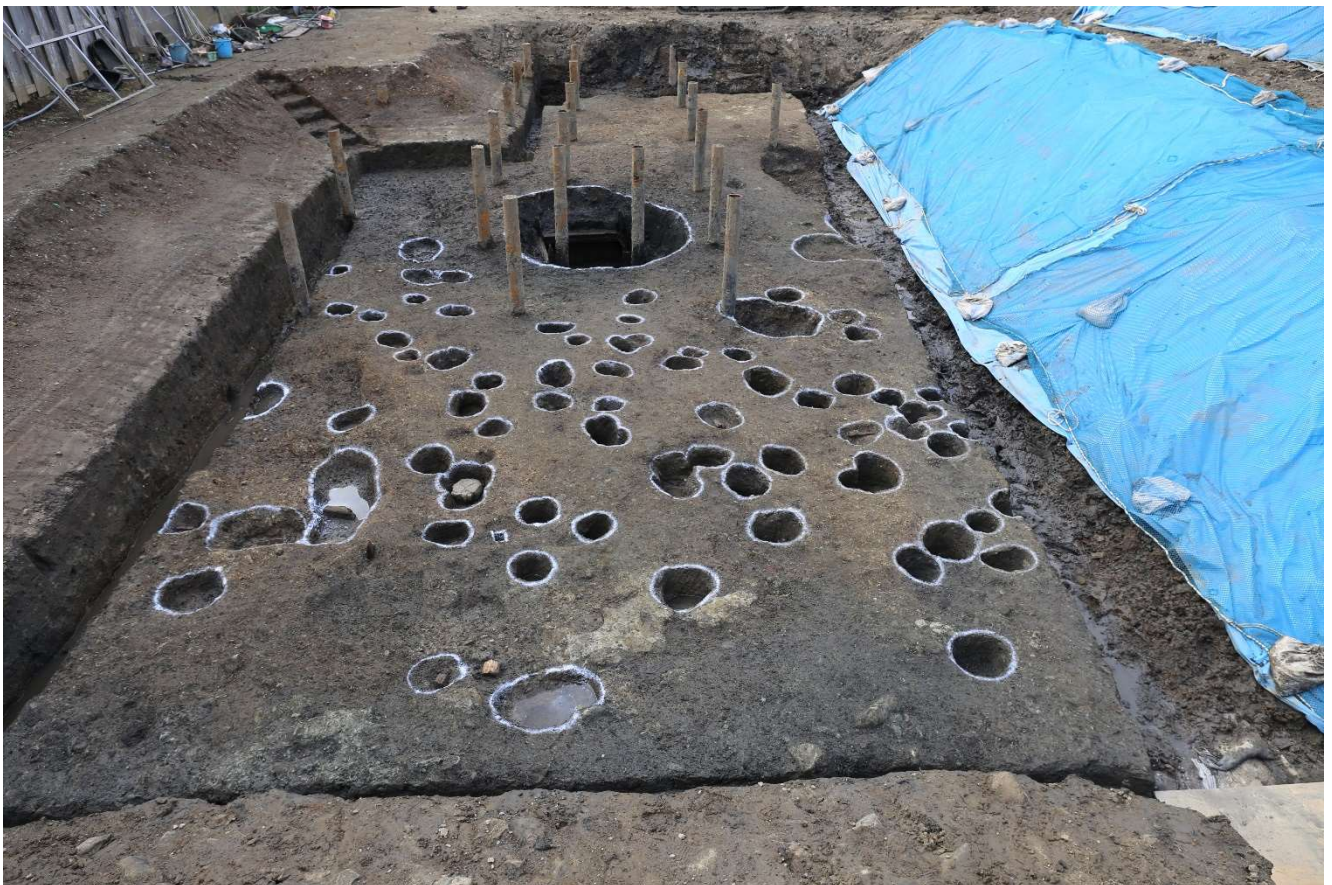
写真2 調査区全景写真(東から) 白丸で囲まれた穴は柱の穴、奥の大きな白丸は井戸跡 (photo2) Entire research area (from east). Holes surrounded by white circles are holes for pillars, and a big white circle of the top of the photo shows remains of a well

調査地点では、鎌倉時代の生活面の建物遺構の密度は低く、敷地内の建物はまばらであったと推定されています。なかには粗末なバラック小屋を想像させる建物もあることから、西側で発見された武家屋敷とは異なり、庶民の居住する区画であったと推定されています。現在の御成小学校で発見された遺跡でも、武家屋敷と道路を挟んだ向かい側には庶民の居住区が発見されており、武士と庶民の居住域が混在した都市生活の実態が明らかにされつつあります。