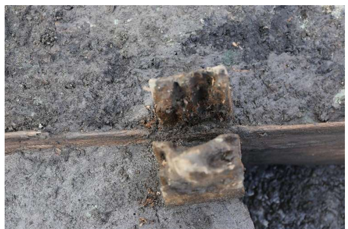
写真6 柱と横板の拡大写真

(photo5) Remains of plate fences defining the premises