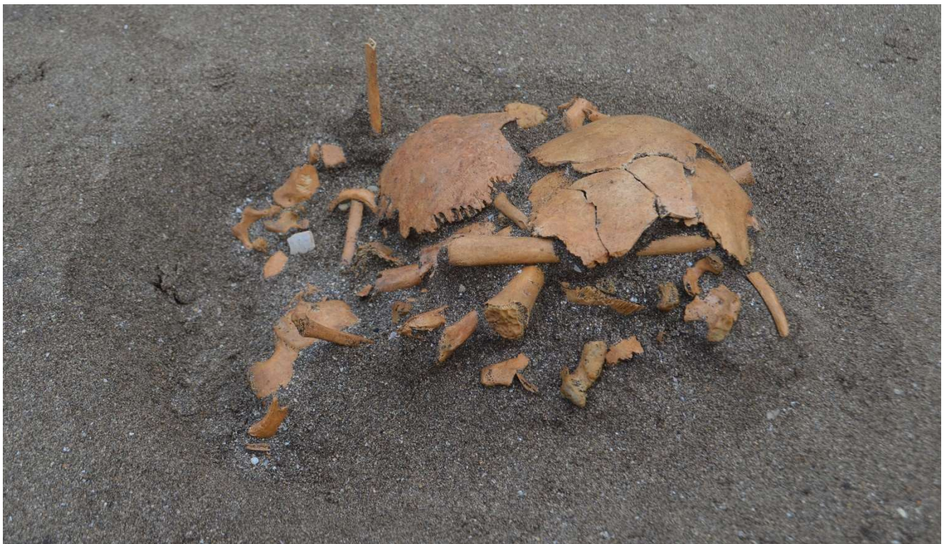
写真 16 2号人骨出土状況

2号人骨は、推定年齢は5才前後で、性別は不明です。埋葬された時代は9～10世紀頃と推定されています。