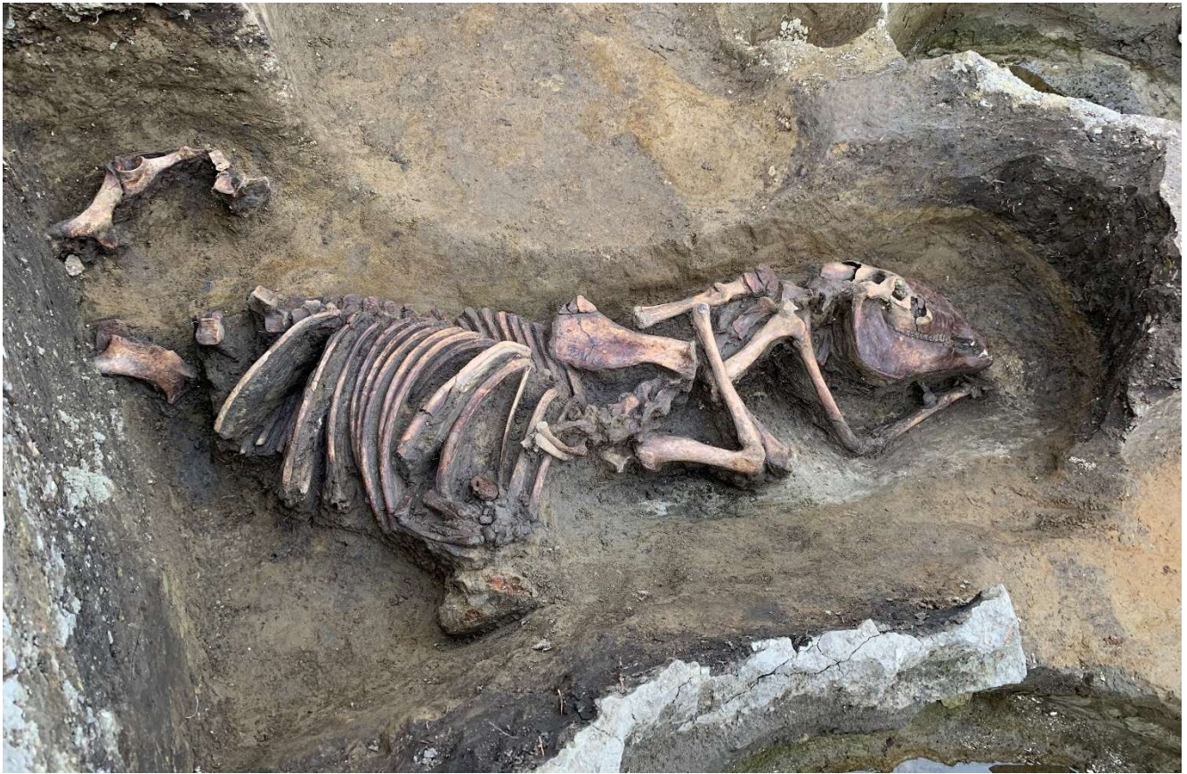
写真 8 細長い穴に埋められた馬の骨

(photo8) Horse bone buried in a narrow hole