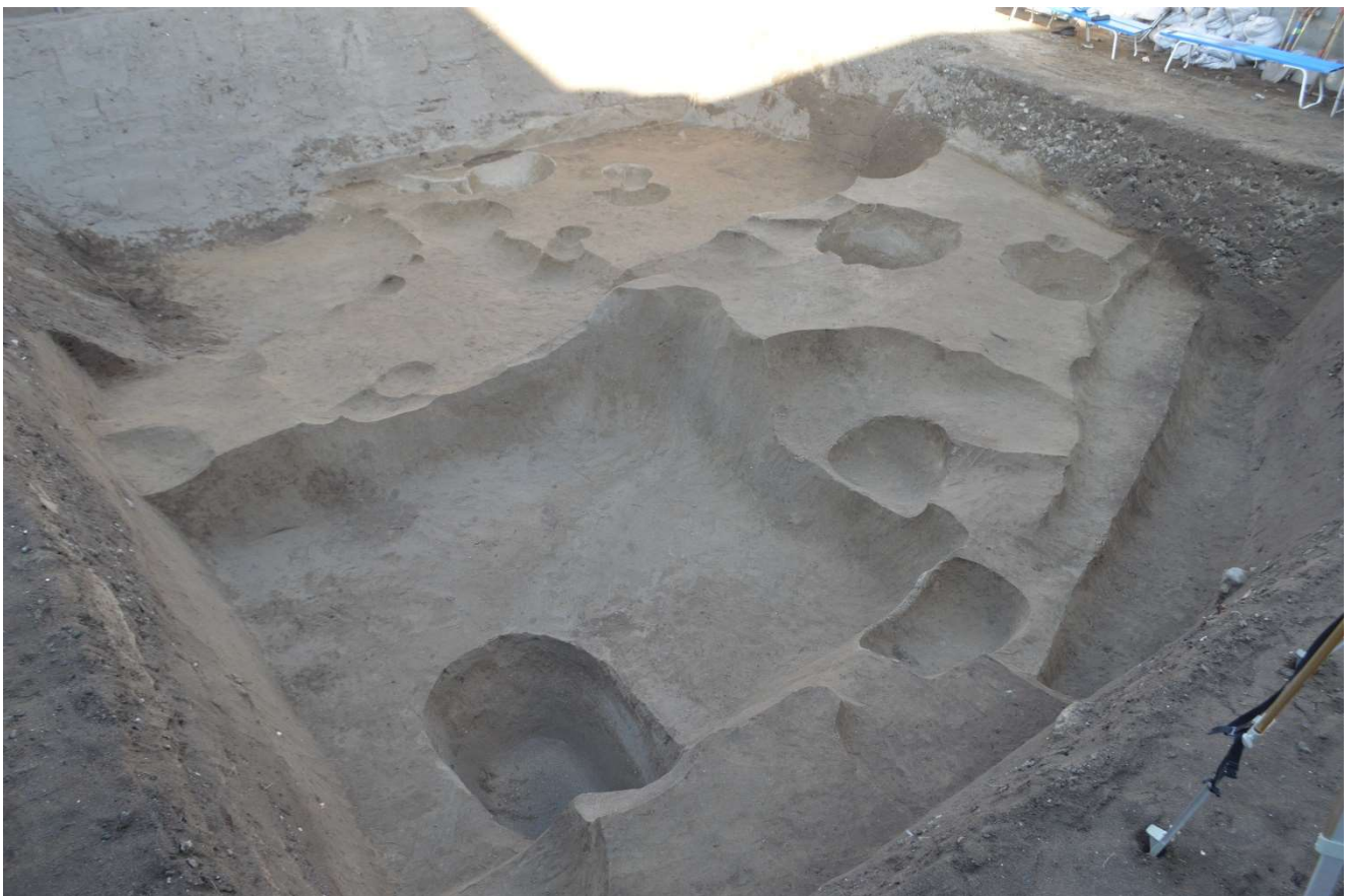
写真 14 鎌倉時代の全景写真 手前の四角い穴は半地下式の建物の痕跡

鎌倉の海浜地区を中心に多く見つかる鎌倉時代の半地下式の建物は、貿易に係る倉庫跡と考えられています。古墳時代から平安時代の土器や陶器、貝殻などの自然遺物等、約500点が出土しています。多くは土師器の つぎ 坏や壺、須恵器の皿で、中には か 甲斐国（現在の山梨県・長野県）で生産された土師器の坏も出土しています。古代の地層からは多くの遺物が出土していますが、建物などの痕跡は乏しく、また墓に葬られた人骨が出土していることから、葬送に係る場所であった可能性が指摘されています。