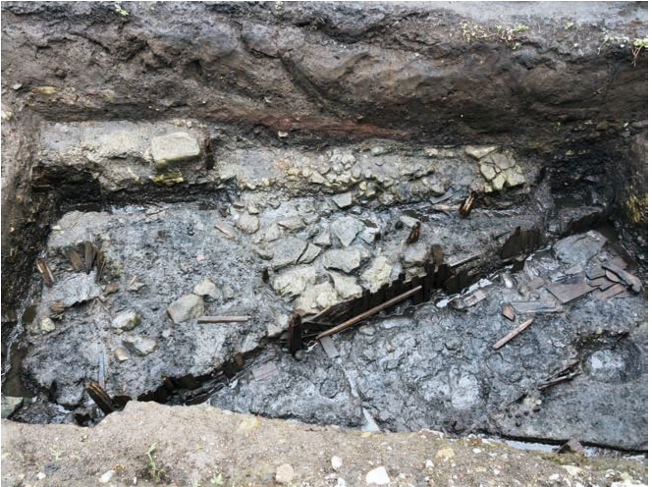
写真 3 遺構検出状況 (photo3) Status of remains detection