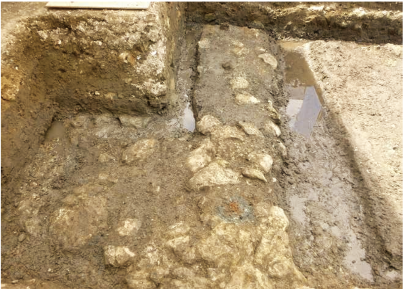
写真1 道路検出状況(写真右が北) (photo1) Status of road detection (right of photo is north)

※土坑：土を掘りくぼめてできた穴のうち、柱穴より大きく、性格や機能の特定ができないもの。