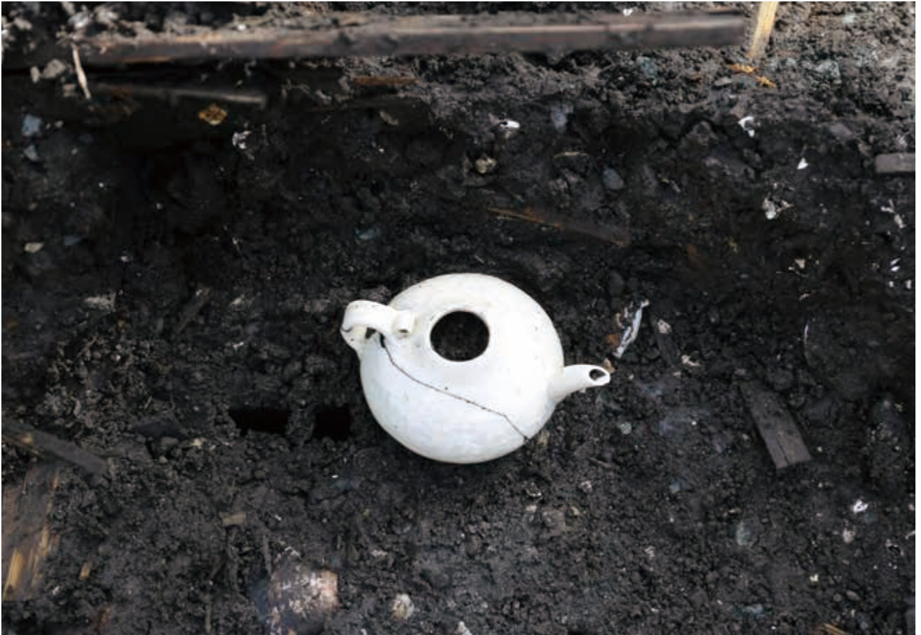
写真9 白磁 すいちよう 水注 (photo9) White porcelain water vessel