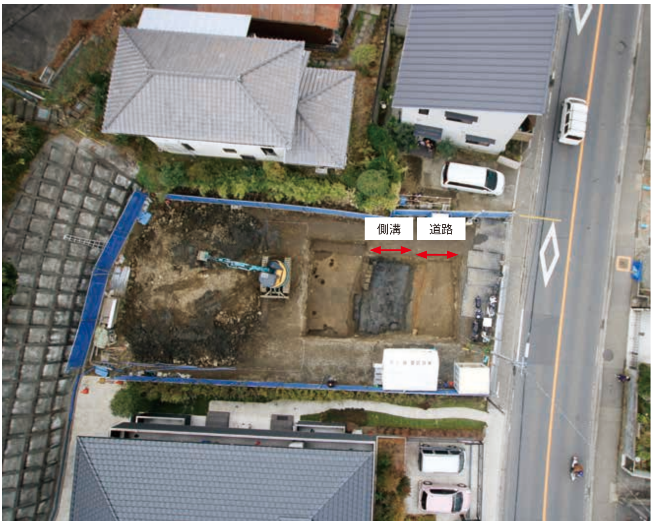
写真11 調査地上空から（写真左が北）

正法寺に直接関わる建物跡などは発見されませんでした。天目茶碗や茶入れなどの喫茶に用いられていた道具類や、瓦などが出土していることから、調査地付近に寺院の主要な建物があつたと考えられます。調査地点の谷戸の奥には一段高い平場があり、寺院の中心は付近を一望できるその平場にあつた可能性もあります。