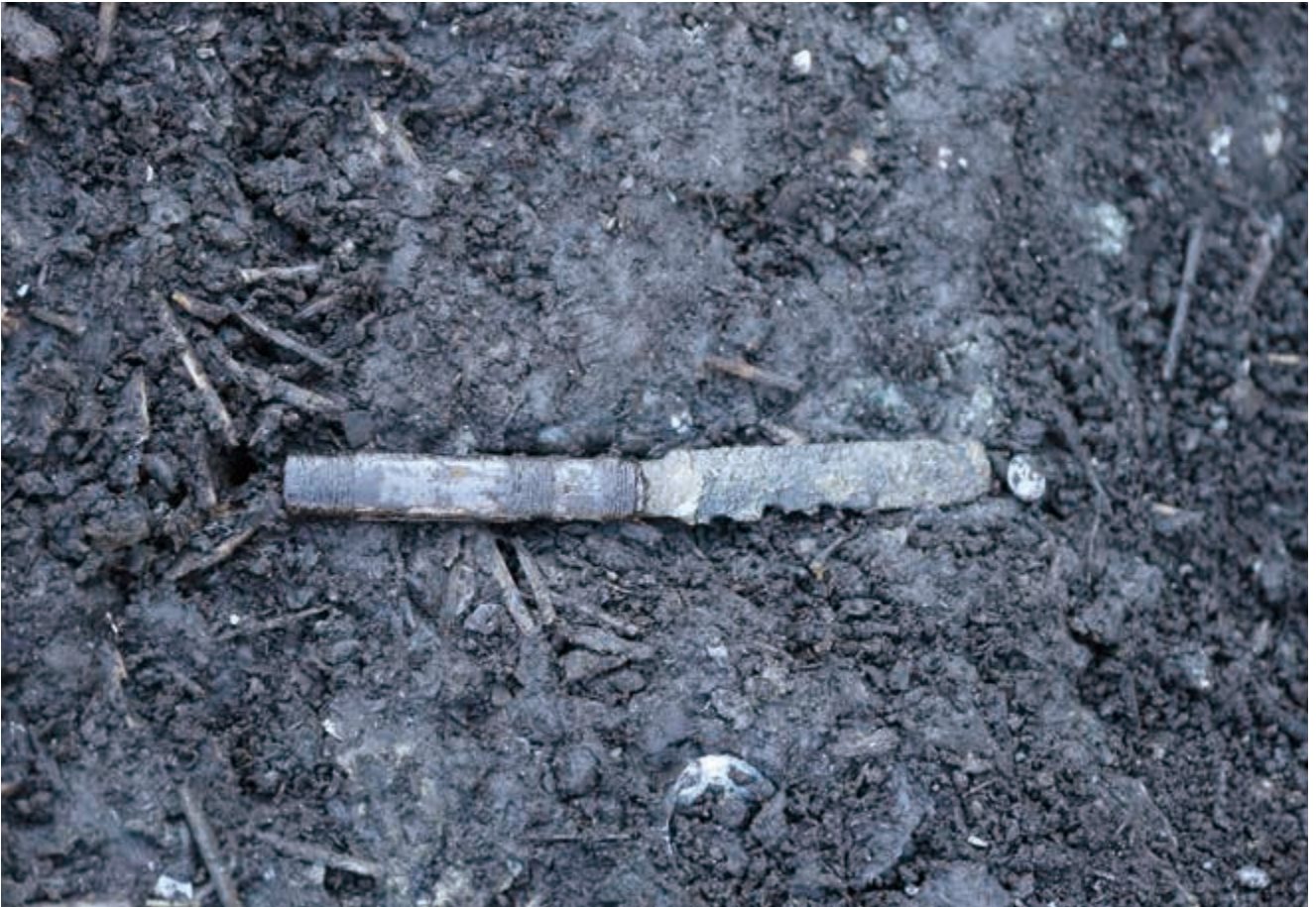
写真7 かみそり 剃刀 (photo7) Razor