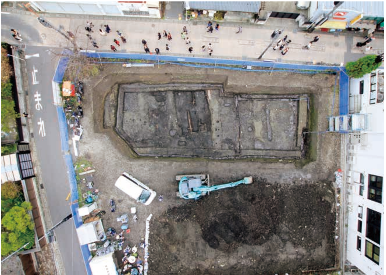
写真4 調査地上空から(写真上に小町通り、写真左が北)

(photo4) Birds-eye view of survey site (photo top is Komachi-dori Street, left is north)