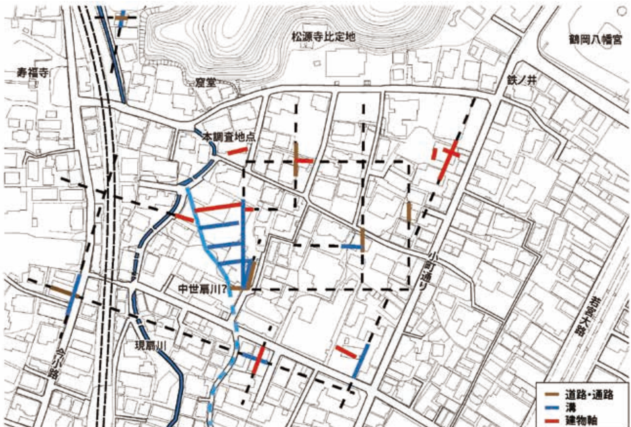
図1 調査地周辺の区割推定

(fig1) Estimated demarcation of north-west portion of Wakamiya-Ohji-Shuhen-Isekigun