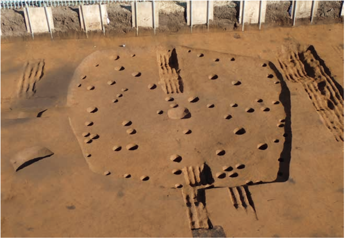
写真 15 豎穴住居跡 (右) (photo15) Pit dwellings