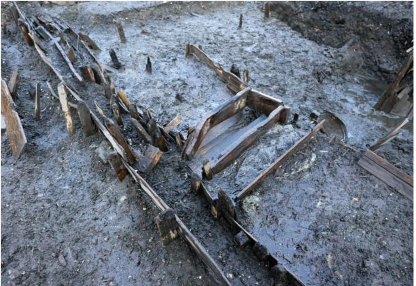
写真5 箱状の木組遺構 (photo5) A box-shaped wooden frame