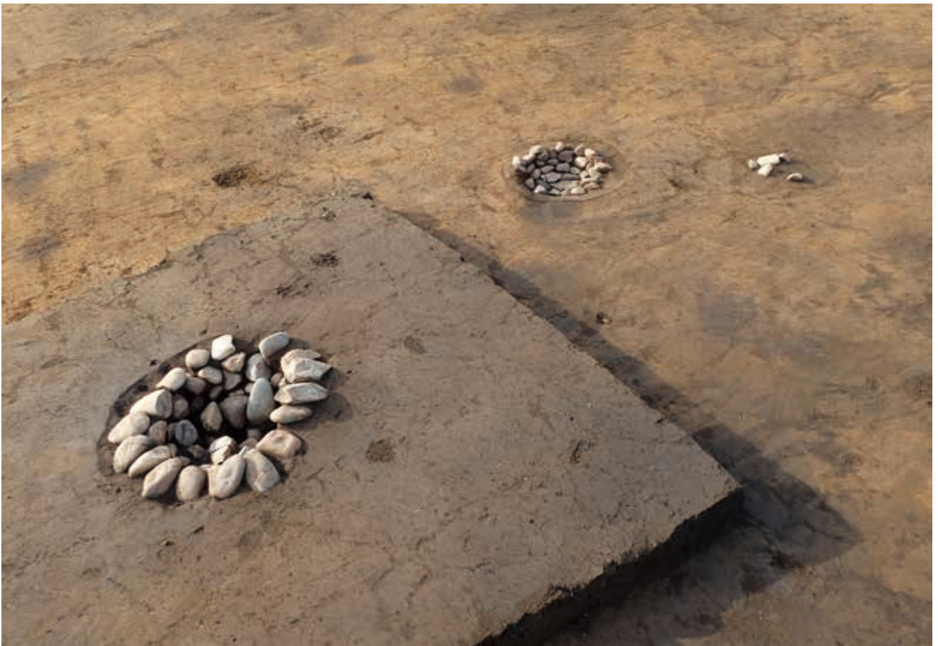
写真 16 集石遺構 (photo16) Remnants of rock pilings