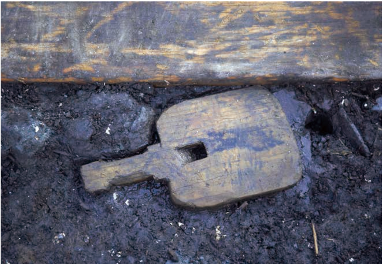
写真10 鋤 すき (photo10) Spade