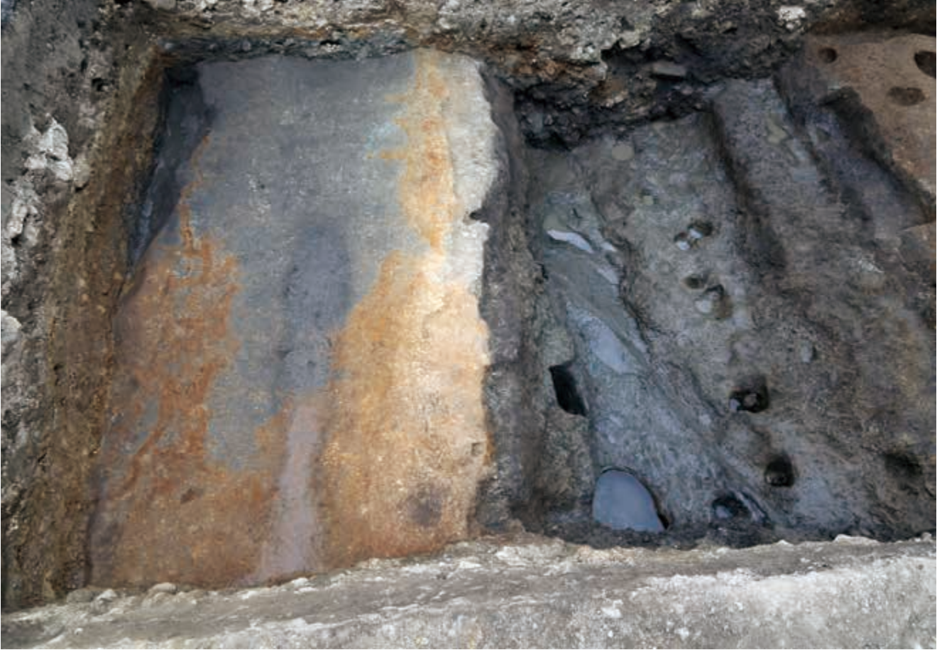
写真 12 道路跡（左）と側溝（右） (photo12) Remnants of road (left) and ditch (right)