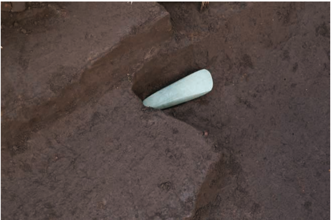
写真14 磨製石斧 (長さ約17cm)

※垂飾品：装身具の一つ。主に石や骨などで作られ、紐を通して首飾りのように使われていたと考えられる。