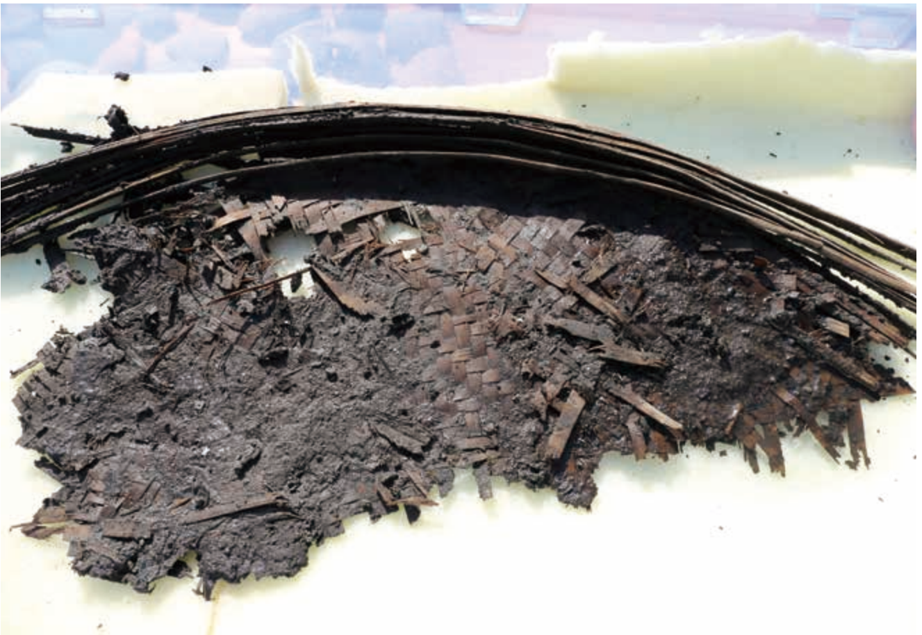
写真8 ざる 笊 (photo8) Colander