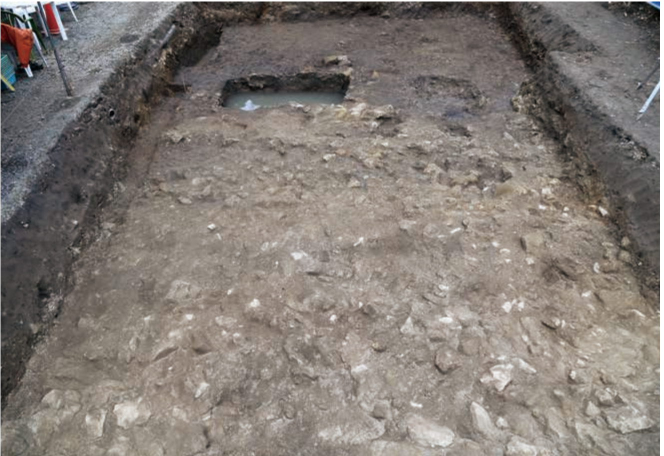
写真 13 泥岩を敷き詰めて造られた道路跡 (photo13) Remnants of road made from crushed mudstone