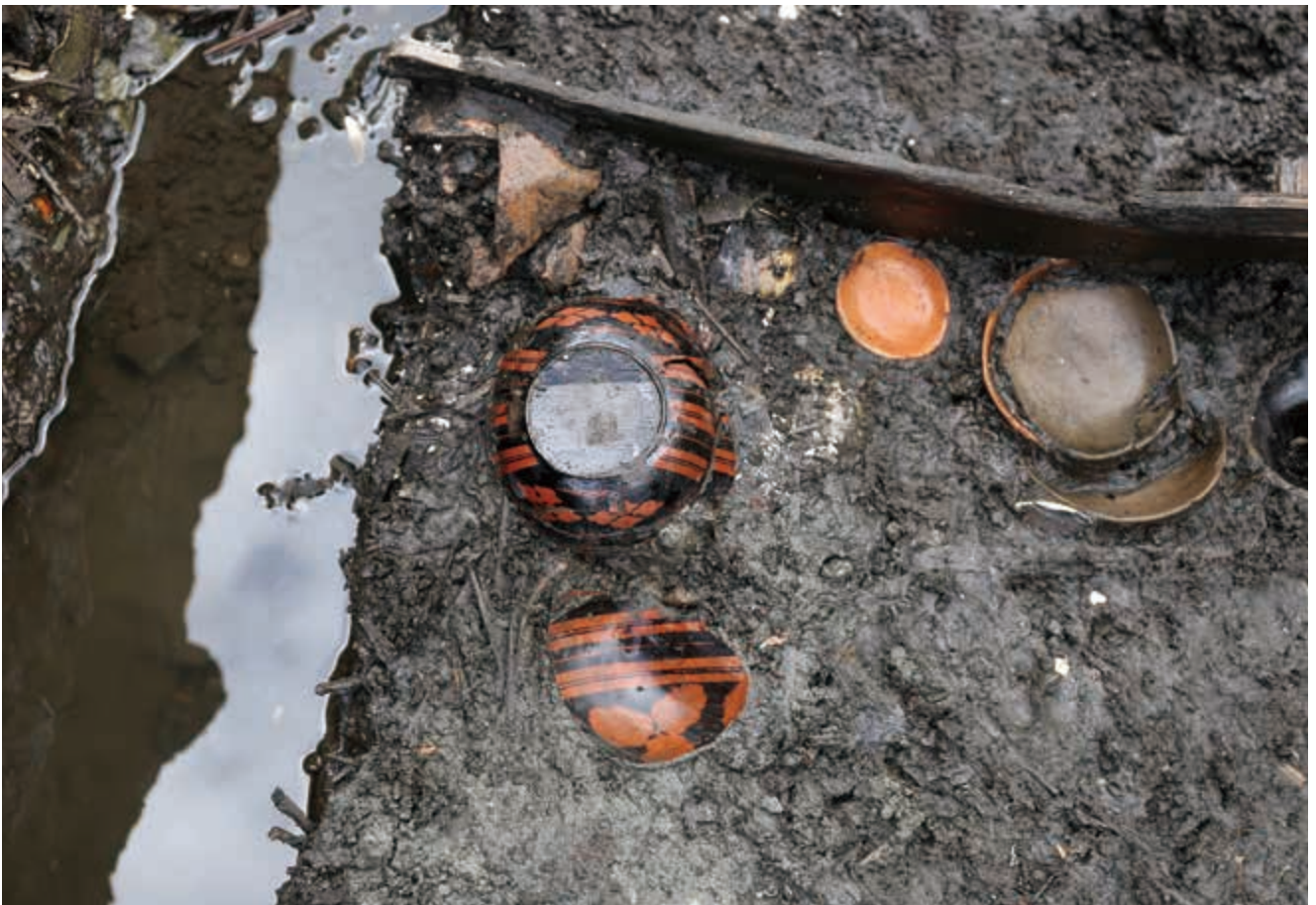
写真6 漆器 (photo6) Lacquerware