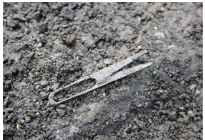
写真 17 若宮大路周辺遺跡群(雪ノ下一丁目 148 番 1 地点) 出土 ハサミ 鋏

Hanging ornaments : A type of personal adornment. It is believed that they were used as a string necklace, and made mainly from stone, bone or other material.