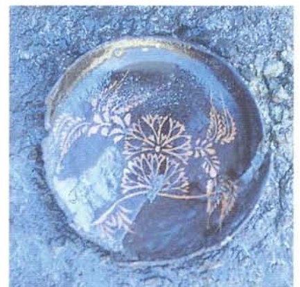
漆器皿の出土状況（佐助ヶ谷遺跡）

The site is on the hill 700m from JR Kitakamakura station. We could find 2 sites of pit dwellings of latter part of Middle Yayoi Period, 8 tunnel-type tombs of 7 th century, and a site of stone quarry of around 15 th century from the vast area of about 12,500m 2 . Especially the site of stone quarry was found at the top of hill to south-facing slope, and cutting out stones spots are about 604. Observing the trace of chisel and arrow, we can imagine people here cut stone off in square with chisel and shot an arrow to take out completely. These cutting off stones are named “Kamakura Ishi (stone)” and the sites of “Kamakura Ishi” quarries are found on the hill country of Kamakura city, south of Yokohama and Zushi area. “Kamakura Ishi” was excavated from several Medieval Sites in Kamakura city and used for building materials up to recent years.