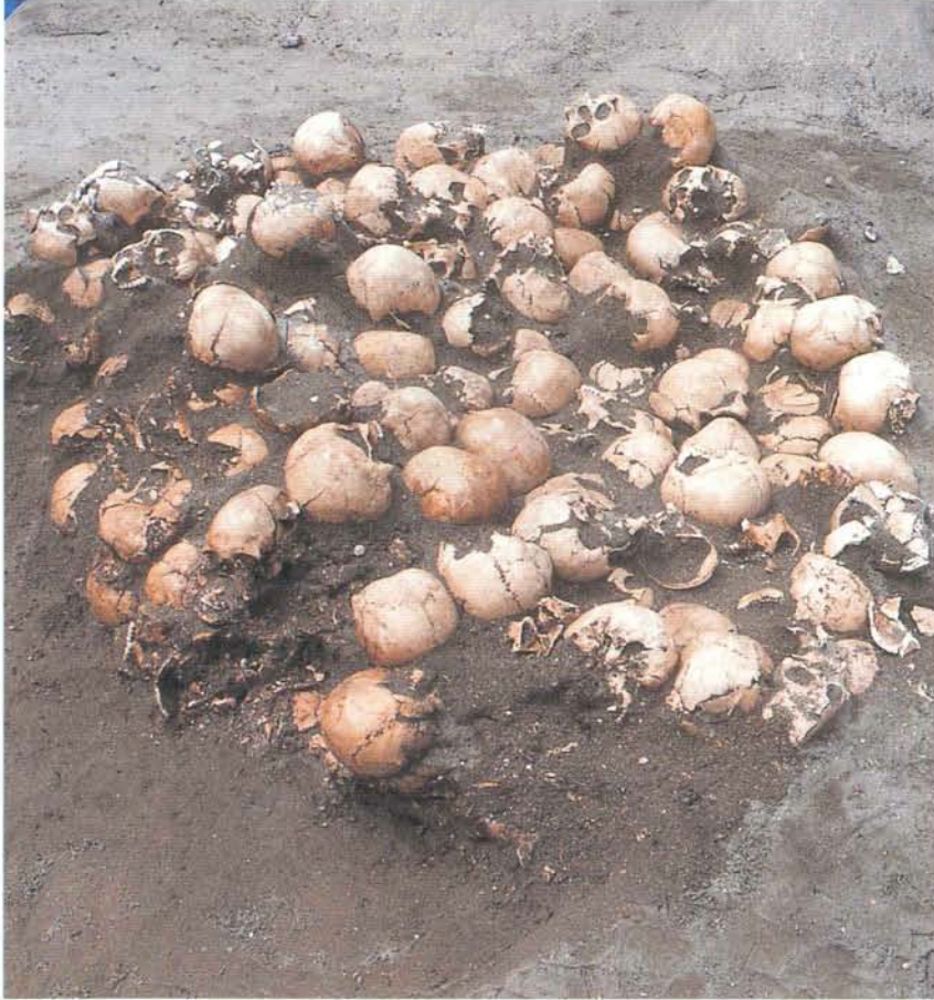
頭蓋骨をまとめて入れた大穴