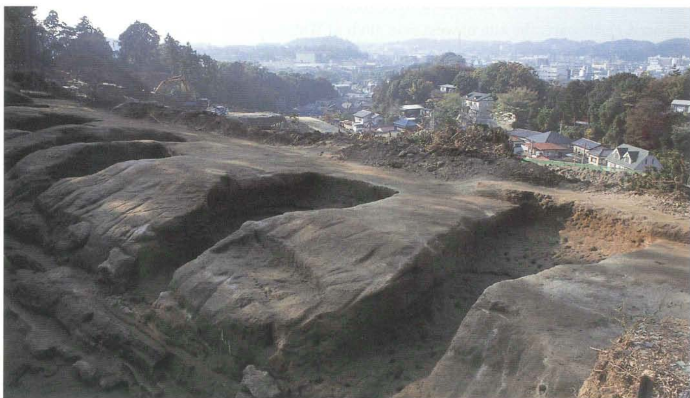
横穴墓群（古墳時代・天井部が失われている）