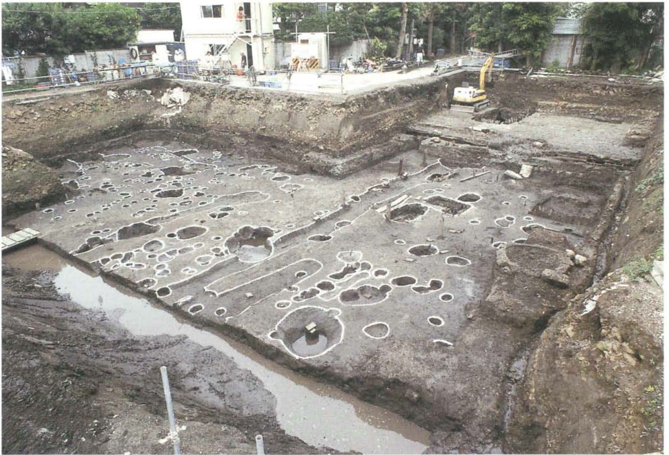
調査区全景（画面右上が大町大路と思える道路状遺構）