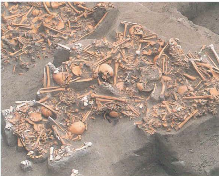
人骨をまとめて入れた大穴