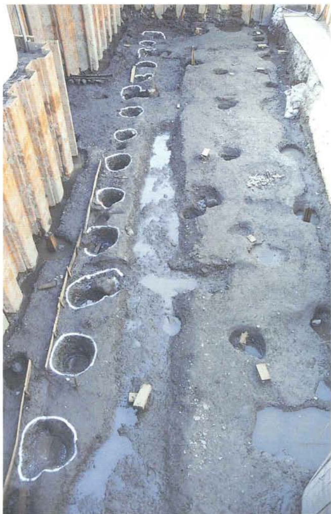
溝と掘立柱の堀の跡