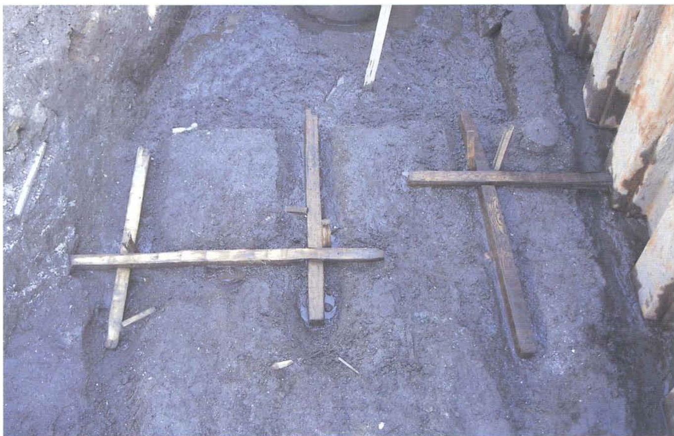
溝側板の倒壊防止用の木組み