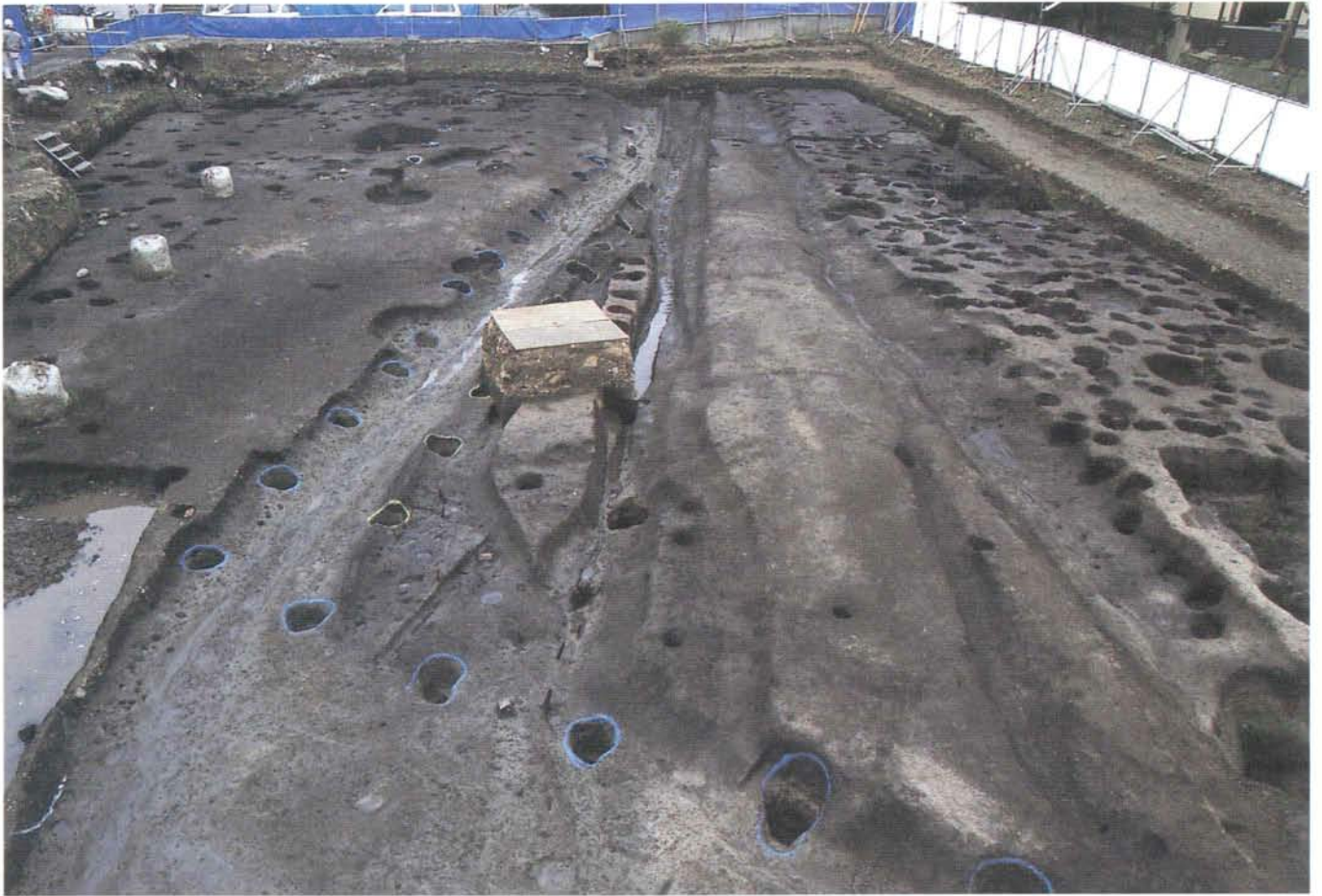
溝と武家屋敷・掘立柱建物群の跡