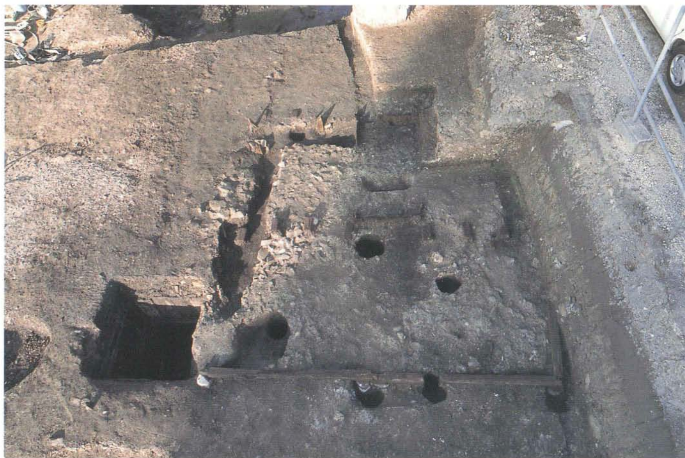
木製土台の建物（左隣は井戸）