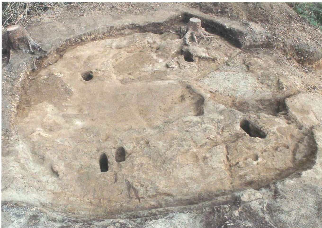
竪穴住居址（弥生時代）