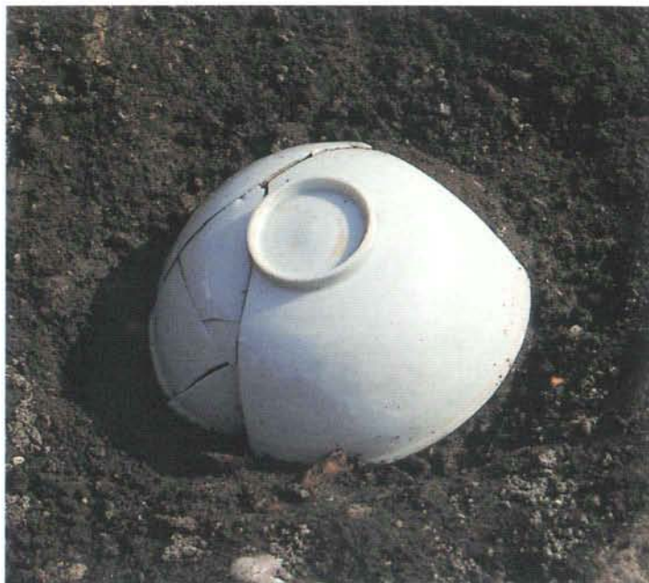
出土した白磁の碗

遺跡は鎌倉の東、名越ヶ谷の入口に位置し、妙法寺・安國論寺・長勝寺といった日蓮宗の寺院がま まっている所です。調査地は妙法寺と安國論寺にはさまれた谷戸の入口部分で、13世紀中頃から14世紀 にかけて3つの時期の生活面がありました。13世紀中頃と推定される地面では谷の中央に東西方向に道 路が通り、その北側に門がある大規模な屋敷が、南側に小規模な建物が密に存在する区域がある ことが判明しました。次の13世紀後半と考えられる地面では道の奥が埋め立てられ、屋敷の中 に取り込まれている事がわかりました。北側の屋敷には礎石建物跡や門と思える柱穴列、 たまじり玉砂利敷きの遺構などがありました。出土品のなかには白磁の優品が複数見られる事などか ら、相当規模の財力を持つ人が住んだ屋敷であったと考えられます。