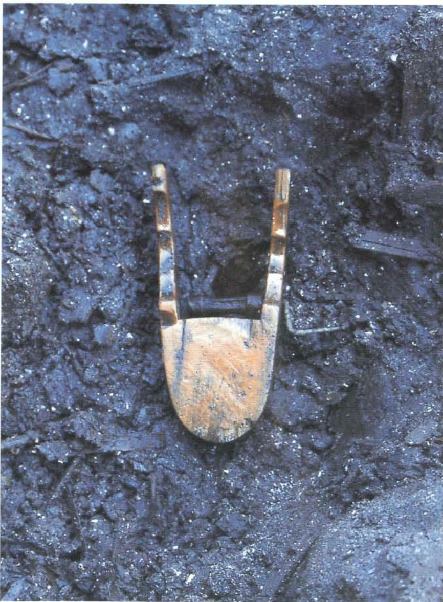
墨壺の出土状況（裏面）

このほか今回の発掘調査では、大工道具の墨壺や呪いに使われた呪符などの興味深い品が出土しています。中世の墨壺はこれまでも奈良東大寺の南大門で見つかったものがよく知られていますが、本遺跡のものは東大寺の墨壺と非常によく似た形をしており、発掘調査による出土品としては全国的にも大変珍しいものと思われま