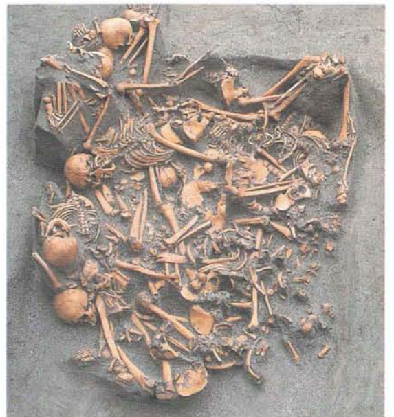
人骨をまとめて入れた大穴