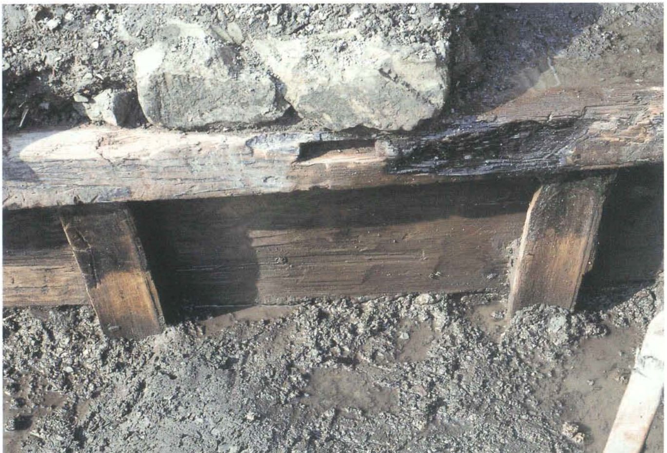
道路側溝の木組み